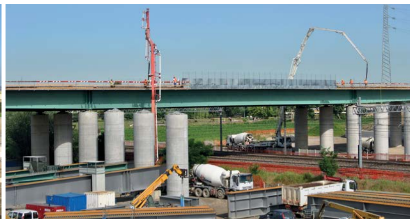
Losa en viaducto