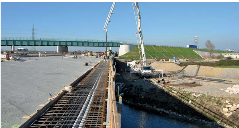
Viga de borde

MAPEI recomienda el uso de Mapecrete Film en la superficie del concreto para evitar la evaporación de agua y asegurar la disponibilidad constante de agua para maximizar la hidratación del concreto.