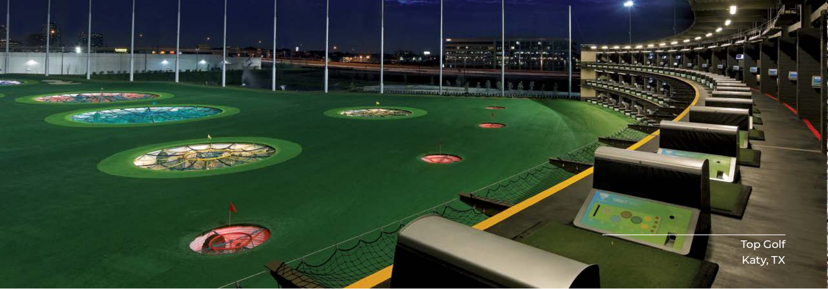
Top Golf Katy, TX