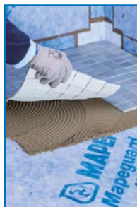
Verlegung von Glasmosaik Mapeguard WP 200