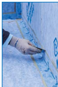
Anwendung von Mapeguard ST