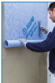
Anwendung von Mapeguard WP 200