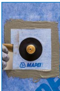
Anwendung von Mapeguard PC