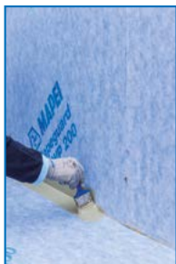
Anwendung von Mapeguard WP Adhesive zur Verklebung von Mapeguard ST