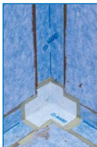
Nahaufnahme einer abgedichteten Ecke mit Mapeguard IC