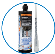
CARTOUCHE 420 ML