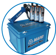
MAPEFIX BOX 15 cartouches de 420 ml + Pistolet 24 cartouches de 300 ml + Pistolet