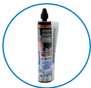
CARTOUCHE 300 ML