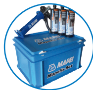
MAPEFIX BOX 15 kokers van 420 ml + pistool 24 kokers van 300 ml + pistool