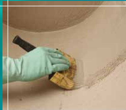
Εφαρμογή με βούρτσα

Τσιμεντοειδής μεμβράνη δύο συστατικών, μεγάλης ελαστικότητας, για τη στεγάνωση επιφανειών από σκυρόδεμα όπως μπαλκόνια, ταράτσες, μπάνια και πισίνες.