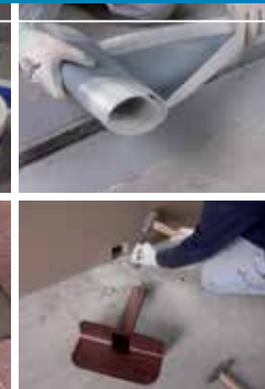
Τα παρελκόμενα του συστήματος

ΔΥΟ ΠΡΟΖΥΓΙΣΜΕΝΑ ΣΥΣΤΑΤΙΚΑ: ΚΑΜΙΑ ΠΙΘΑΝΟΤΗΤΑ ΛΑΘΟΥΣ