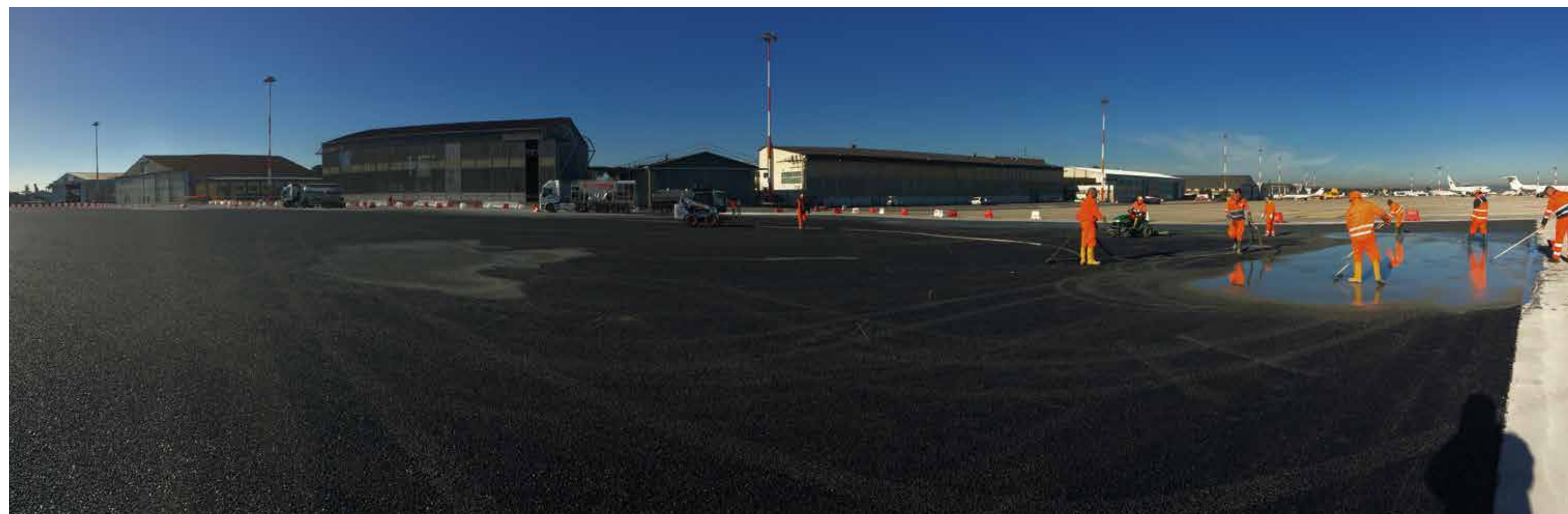
Aeroporto Internazionale di Roma "Ciampino G. B. Pastine" - Roma - Italia Riqualifica del piazzale di sosta

Il prodotto è stabile a elevate temperature, senza la necessità di prevedere giunti di dilatazione, se non previsti nel piano di posa.