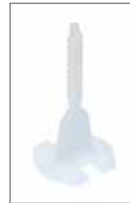
Distanziatori MapeLevel Easy Spacer L Gamma completa di distanziatori a vite, disponibili in tre modelli (lineari, a T e a X) e in cinque differenti spessori (1, 1,5, 2, 3, 5 mm)