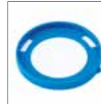
Disco antigraffio MapeLevel Easy Shield Accessorio opzionale. Da applicare alle rotelle a ulteriore protezione della superficie delle piastrelle