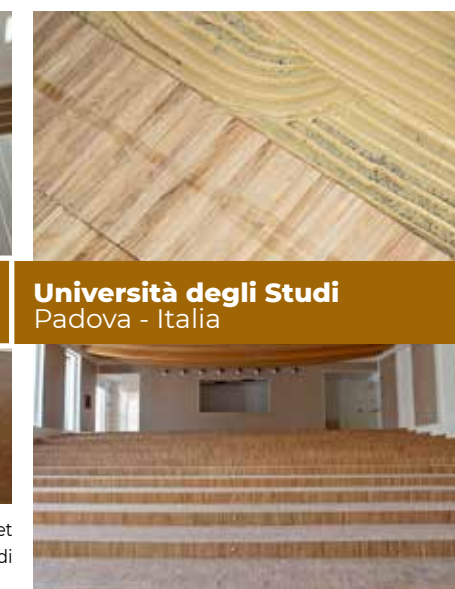
Università degli Studi Padova - Italia

Nella nuova sede del Polo Umanistico dell'Università di Padova sono stati posati oltre 13.000 m 2 di parquet con Ultrabond P913 e trattati con le vernici della Linea Ultracoat . Il cantiere è di fatto uno dei più grandi lavori di Linea dell'anno in Italia.