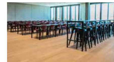
Università FHNW Muttens - Svizzera

Nel rinomato Golf Club in Australia, a Hope Island, i prodotti Mapei per la posa e la cura del parquet sono stati utilizzati nell'intervento di riqualificazione e ampliamento della clubhouse, pensata per ospitare un lussuoso hotel a 5 stelle.