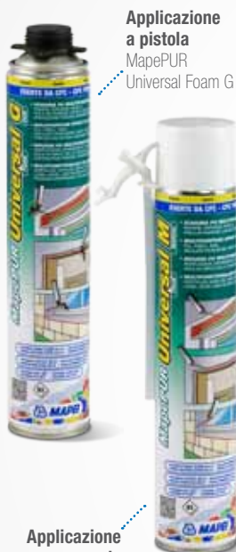
Applicazione a pistola MapePUR Universal Foam G