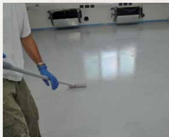
Mapefloor Finish 52 W + Mapelux Opaca