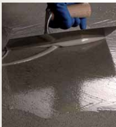
Primer SN + Quarzo 1,2