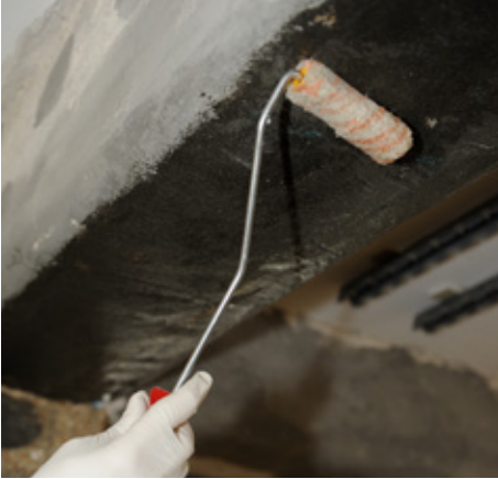
Applicazione di MapeWrap Primer 1