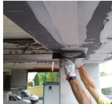
Applicazione di successiva rasatura di MapeWrap 11/12