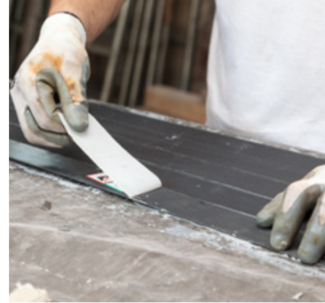
Rimozione peel ply da Carboplate