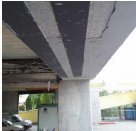
Applicazione di Carboplate