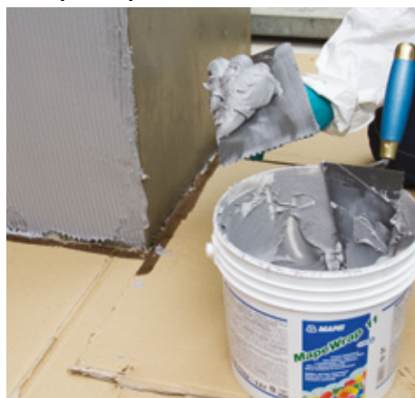
Applicazione di MapeWrap 11 / 12