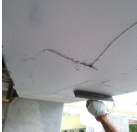
Applicazione di MapeWrap 11/12 su supporto