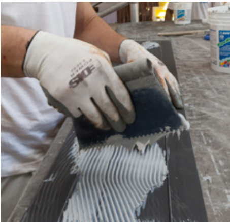
Applicazione di MapeWrap 11/12 su Carboplate