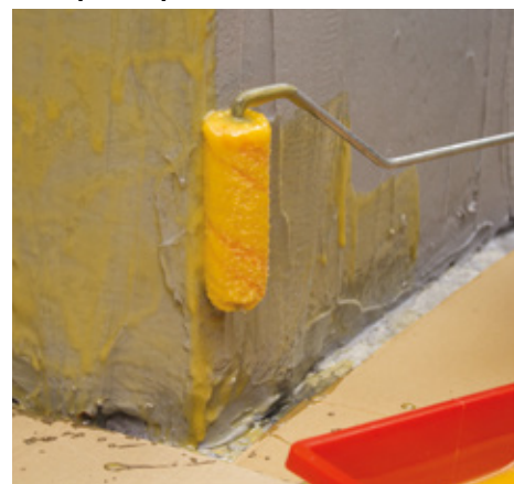
Applicazione della prima mano di MapeWrap 31