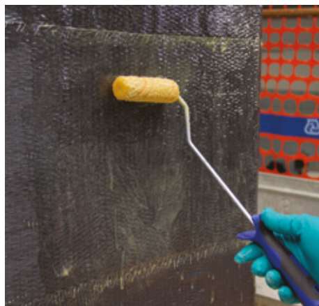
Applicazione della seconda mano di MapeWrap 31