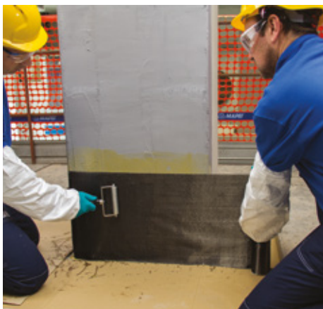
Posa in opera di MapeWrap C UNI-AX