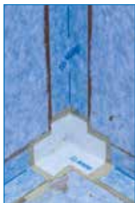
Dettaglio dell'impermeabilizzazione di un angolo con Mapeguard IC