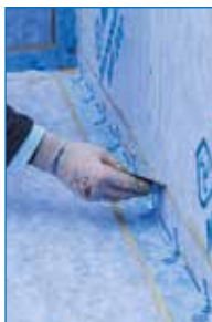
Applicazione di Mapeguard ST