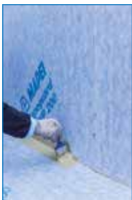
Applicazione di Mapeguard WP Adhesive per l'incollaggio di Mapeguard ST