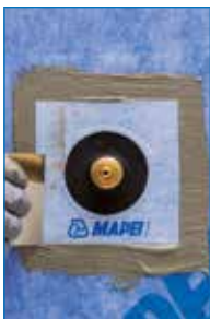
Applicazione di Mapeguard PC