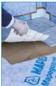
Installazione di mosaico vetroso su Mapeguard WP 200