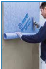
Applicazione di Mapeguard WP 200