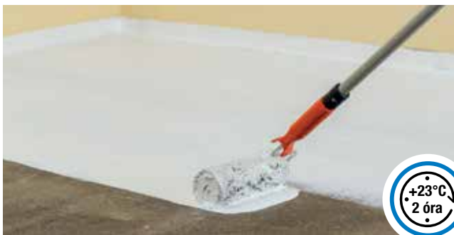
Első réteg felhordása