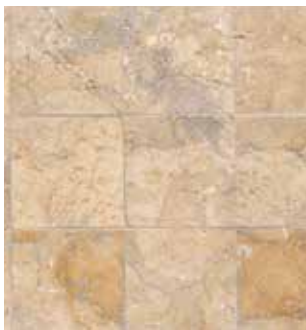
Hidegburkolattal ellátott felületek