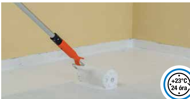
Második réteg felhordása