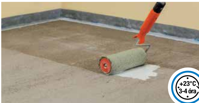
Az aljzat alapozása

A terméket hosszú szőrű hengerrel, ecsettel vagy szórással hordja fel.