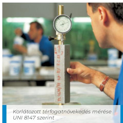
Korlátozott térfogatnövekedés mérése UNI 8147 szerint