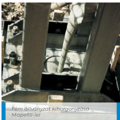
Fém állványzat kihorgonyzása Mapefill-lel