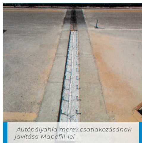
Autópályahíd merev csatlakozásának javítása Mapefill-lel