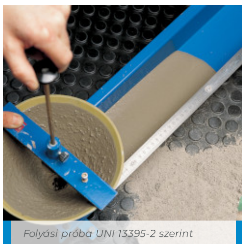
Folyási próba UNI 13395-2 szerint