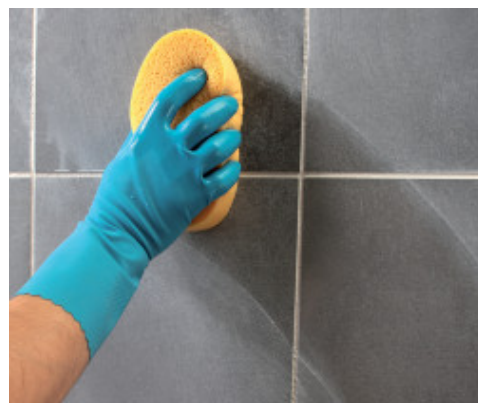
Fugák végleges tisztítása kemény cellulóz szivaccsal