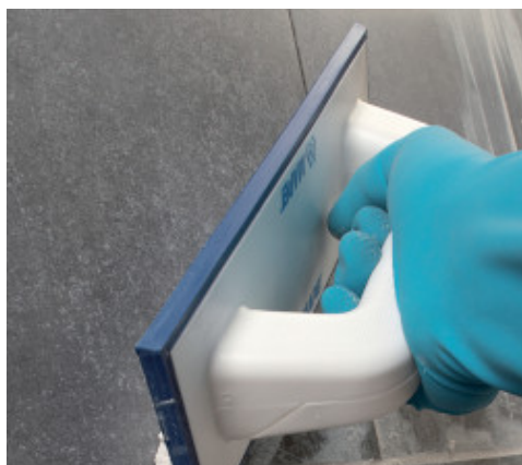
Flexcolor felhordása gumisimítóval

A hőmérséklet és az anyag nedvszívó képességétől függően a felhasználása után 10- 15 perc múlva, amikor a termék felülete már bőrösödött, megnedvesített Scotch-Brite® szivaccsal, átlós irányban haladva tisztítsa le a felesleges Flexcolor -t. A szivacsot gyakran öblítse ki úgy, hogy két külön vödört használ, az egyiket a letisztított fugázóhabarcs kiöblítésére, a másikat pedig, amely tiszta vizet tartalmaz, a szivacs ismételt kiöblítésére. A felület és a fugák végleges tisztításához tehát egy kemény, enyhén nedves cellulóz szivacs használható.