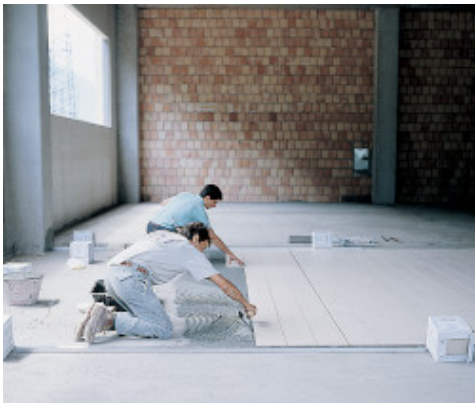
Porcelán burkolólapok fektetése egy gyárba