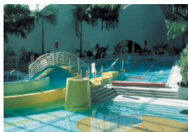
Példa mozaik és klinker burkolólapok ragasztására úszómedencében