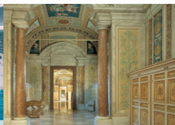
Szixtuszi Folyosók - Vatikán - Róma