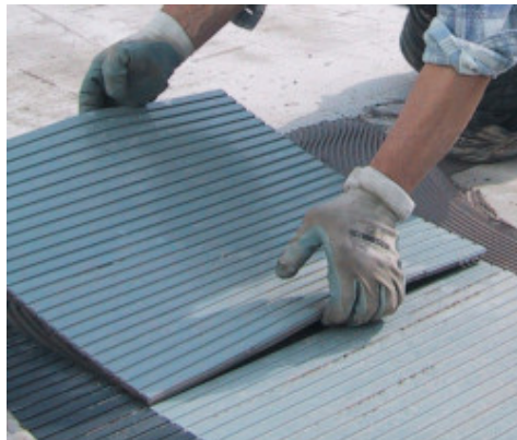
Cementes felület burkolása gumi burkolattal Granirapid-dal