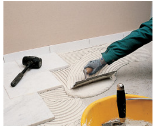
Fehér carrarai márvány ragasztása fehér Granirapid-dal