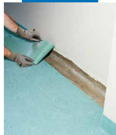
PVCA szegély ragasztása

A termékre vonatkozó referenciák kérésre rendelkezésre állnak, illetve hozzáférhetők a www.mapei.hu és www.mapei.com honlapokon