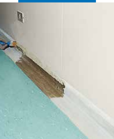
Liuni PVC szegélycsik fektetése Adesilex LP-vel