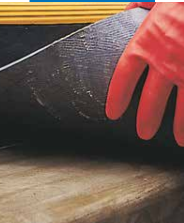
Gumi padlóburkolat ragasztása lépcsőre Adesilex LP-vel