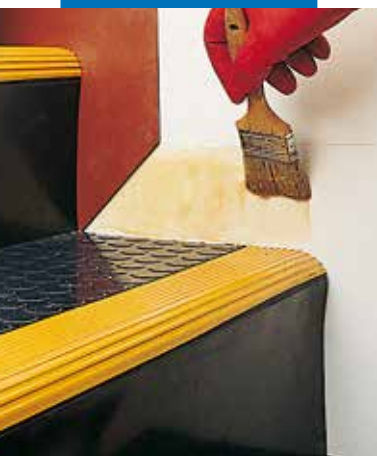
Gumi lábazat ragasztása Adesilex LP-vel