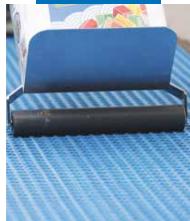
Dociskanie maty do podłoża

* do 3600 cm 2 (długość najdłuższego boku 60 cm) -> Keraflex Maxi S1 od 3600 cm 2 do 10 000 cm 2 (długość najdłuższego boku 100 cm) -> Ultralite S2 lub Ultralite S2 Quick powyżej 10 000 cm 2 (lub bok powyżej 100 cm) -> Elastorapid lub Keraflex Quick S1 + Latex Plus