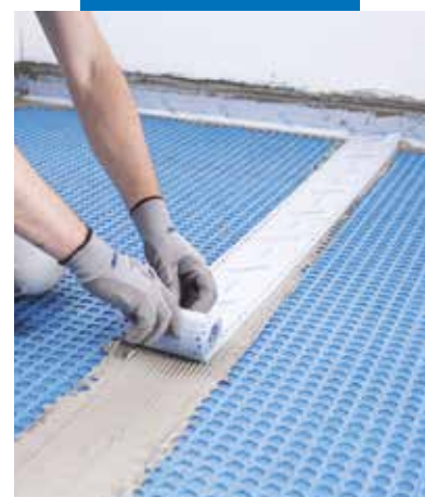
Uszczelnianie łączeń między arkuszami maty taśmą Mapeband W lub Mapeband Easy, przyklejoną klejem Mapeguard WP Adhesive