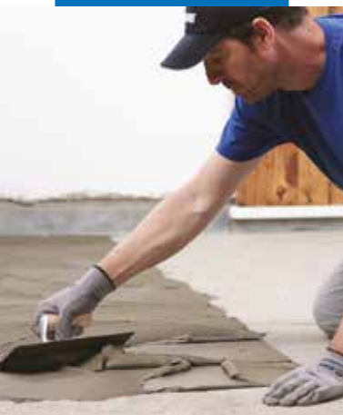
Rozprowadzanie warstwy kleju pacą zębatą nr 5