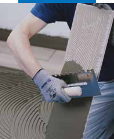
Montaż posadzki ceramicznej lub kamiennej z użyciem odpowiedniego kleju MAPEI klasy co najmniej C2S1