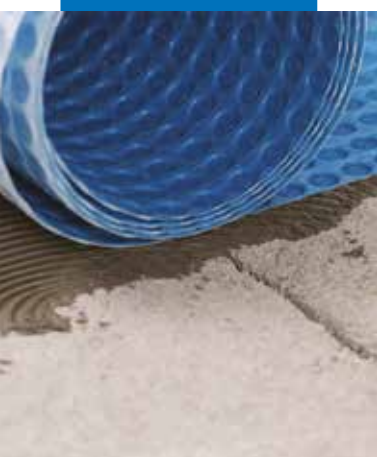
Układanie Mapeguard UM 35