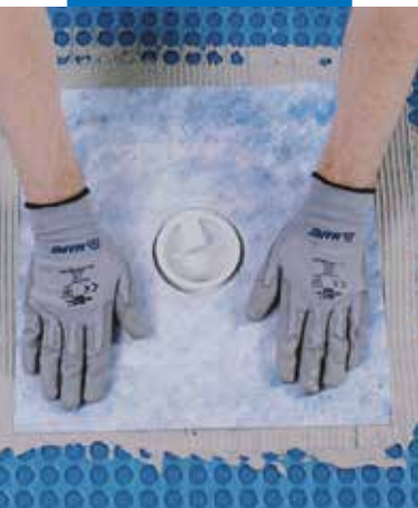
Uszczelnianie odpływu przy użyciu profili Drain Vertical/Drain Lateral