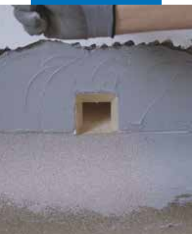
Uszczelnianie odpływu z użyciem profilu Drain Front