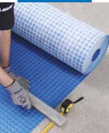
Przycinanie arkusza maty Mapeguard UM 35 do żądanych rozmiarów