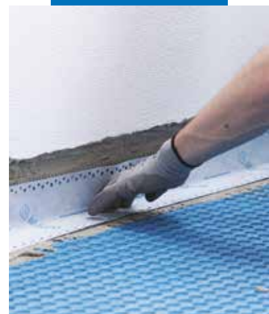
Przyklejanie taśmy Mapeband W lub Mapeband Easy klejem Mapeguard WP Adhesive na styku ściana-podłoga