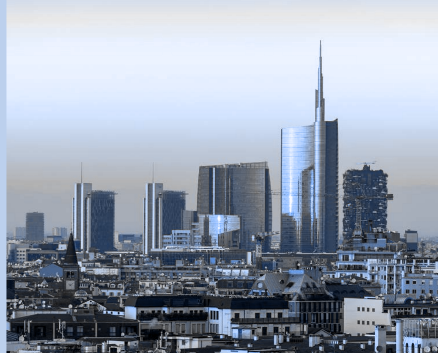
Porta Nuova Milan, Italy

W związku z tym wszyscy adresaci niniejszego Kodeksu zobowiązani są unikać wszelkich sytuacji, w których konflikt interesów może powstać lub może zakłócać, choćby pozornie, ich zdolność do podejmowania decyzji w wyłącznym interesie Grupy.