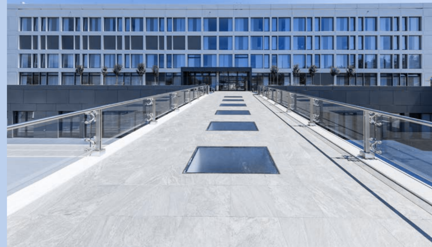
De La Tour Hospital Meyrin, Switzerland

przez Korporacyjny Dział Audytu Wewnętrznego oraz Korporacyjny Dział Kadr i Organizacji) lub za pośrednictwem internetowego Portalu Zgłaszania Nieprawidłowości.