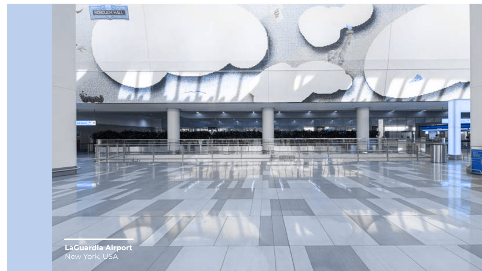
LaGuardia Airport New York, USA