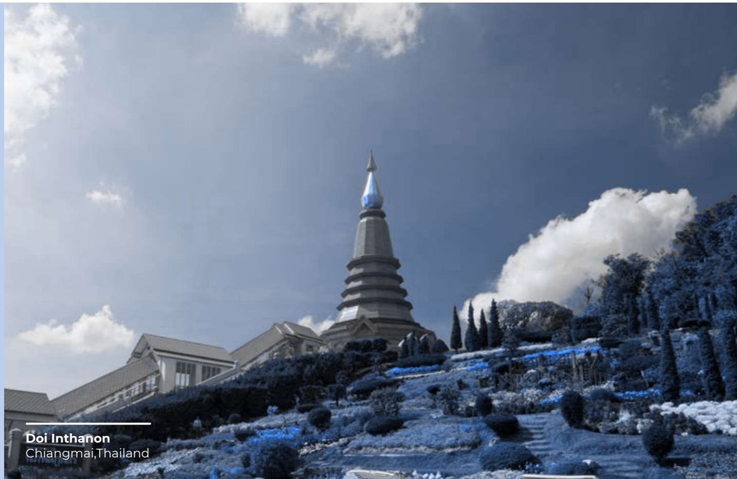
Doi Inthanon Chiangmai, Thailand

Szczególnie ważne jest unikanie otrzymywania jakichkolwiek korzyści osobistych wynikających ze stosunków pracy z Mapei lub zajmowanego stanowiska w Mapei.