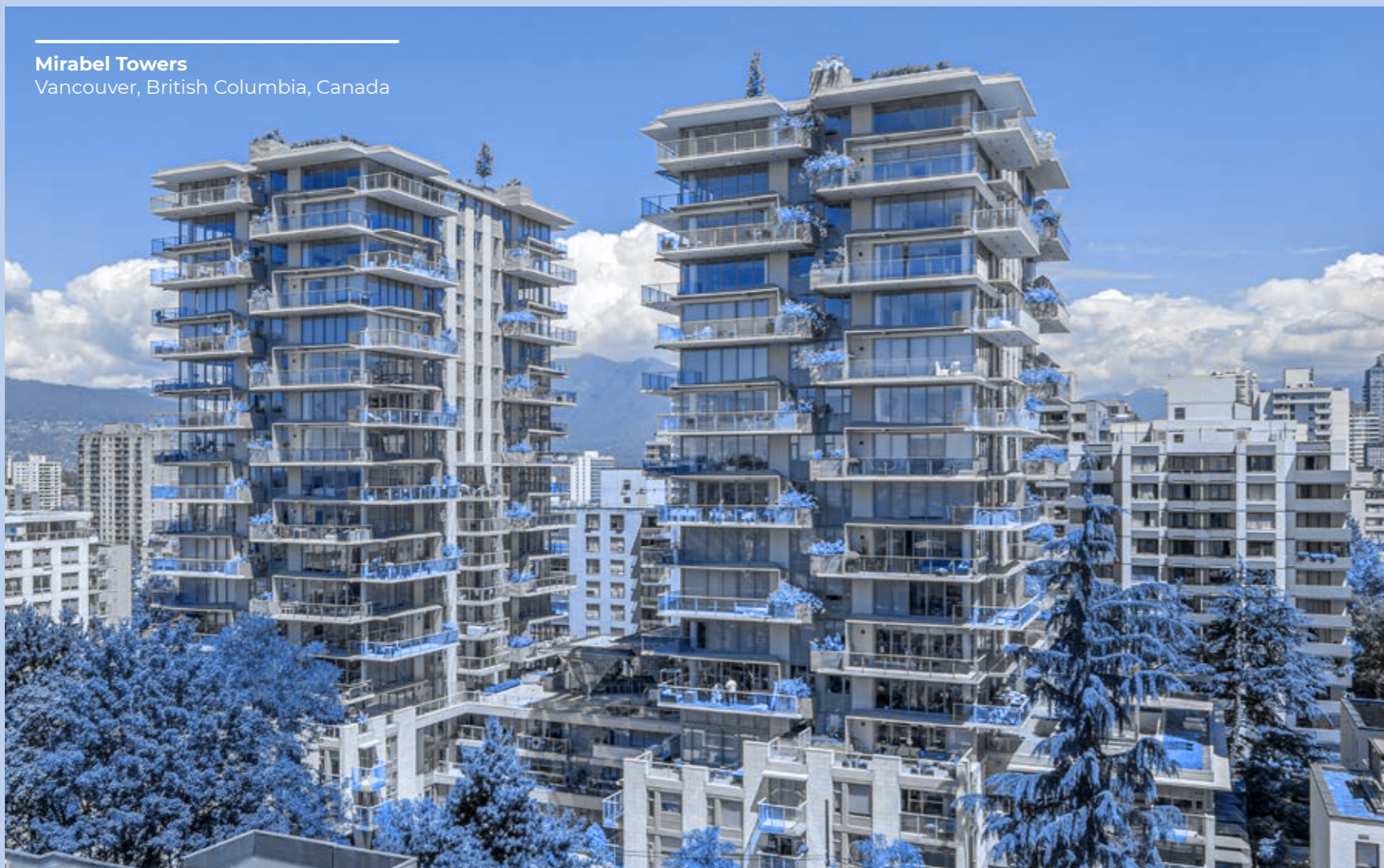
Mirabel Towers Vancouver, British Columbia, Canada