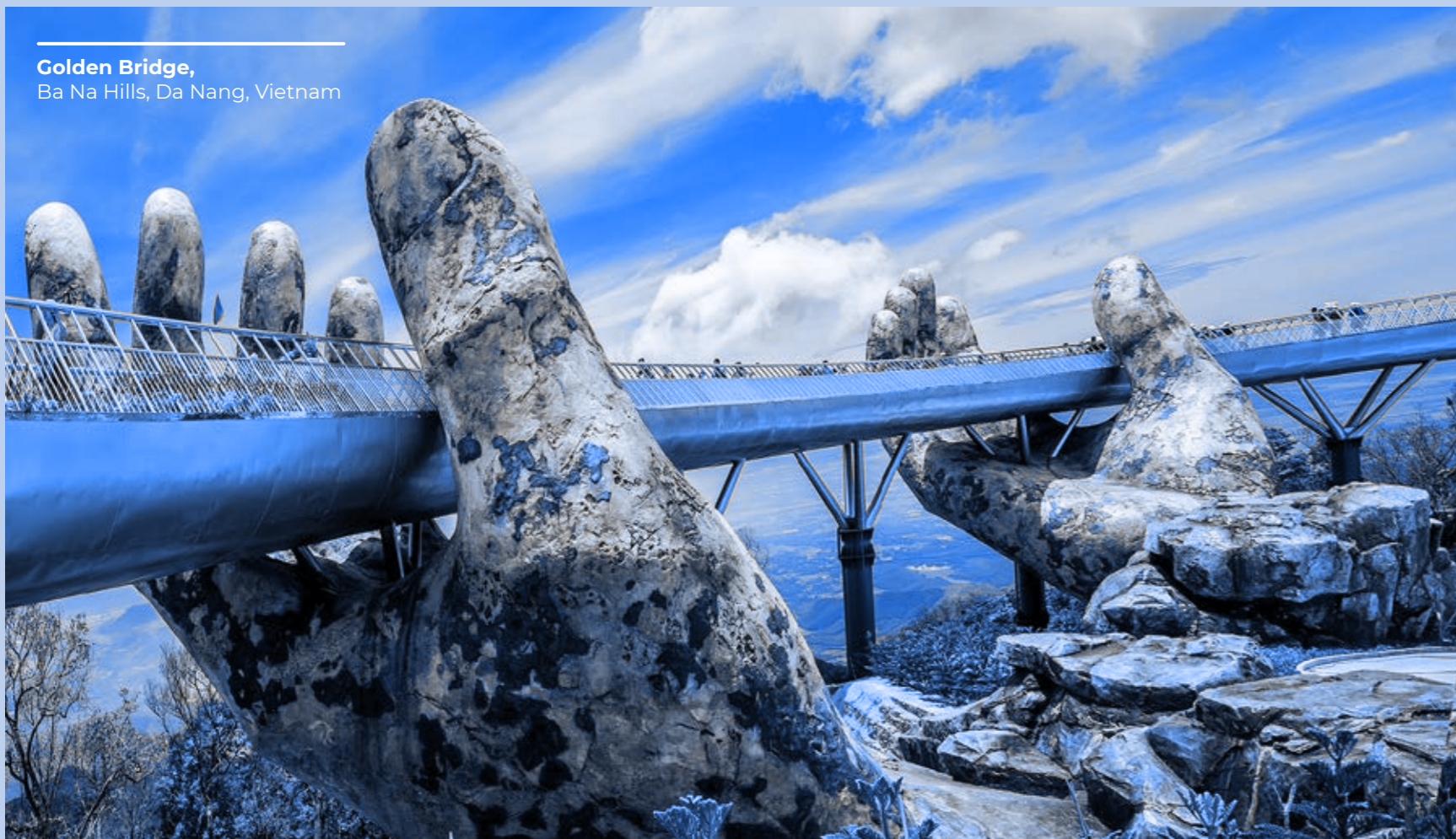
Golden Bridge, Ba Na Hills, Da Nang, Vietnam

Wszyscy Dyrektorzy, Kierownicy i Pracownicy spółek Grupy Mapei (zwani dalej „Zespołem Mapei” lub „pracownikami”) oraz inne osoby i przedsiębiorstwa działające w imieniu lub na rzecz Grupy Mapei (zwane dalej „adresatami Kodeksu”, w tym „Zespół Mapei”) zobowiązani są wykonywać swoje czynności, zadania i obowiązki zgodnie z zasadami, wartościami i regułami określonymi w niniejszym Kodeksie. Przestrzeganie Kodeksu Etyki uważane jest za podstawowy wymóg zobowiązań umownych dla wszystkich członków Zespołu Mapei.