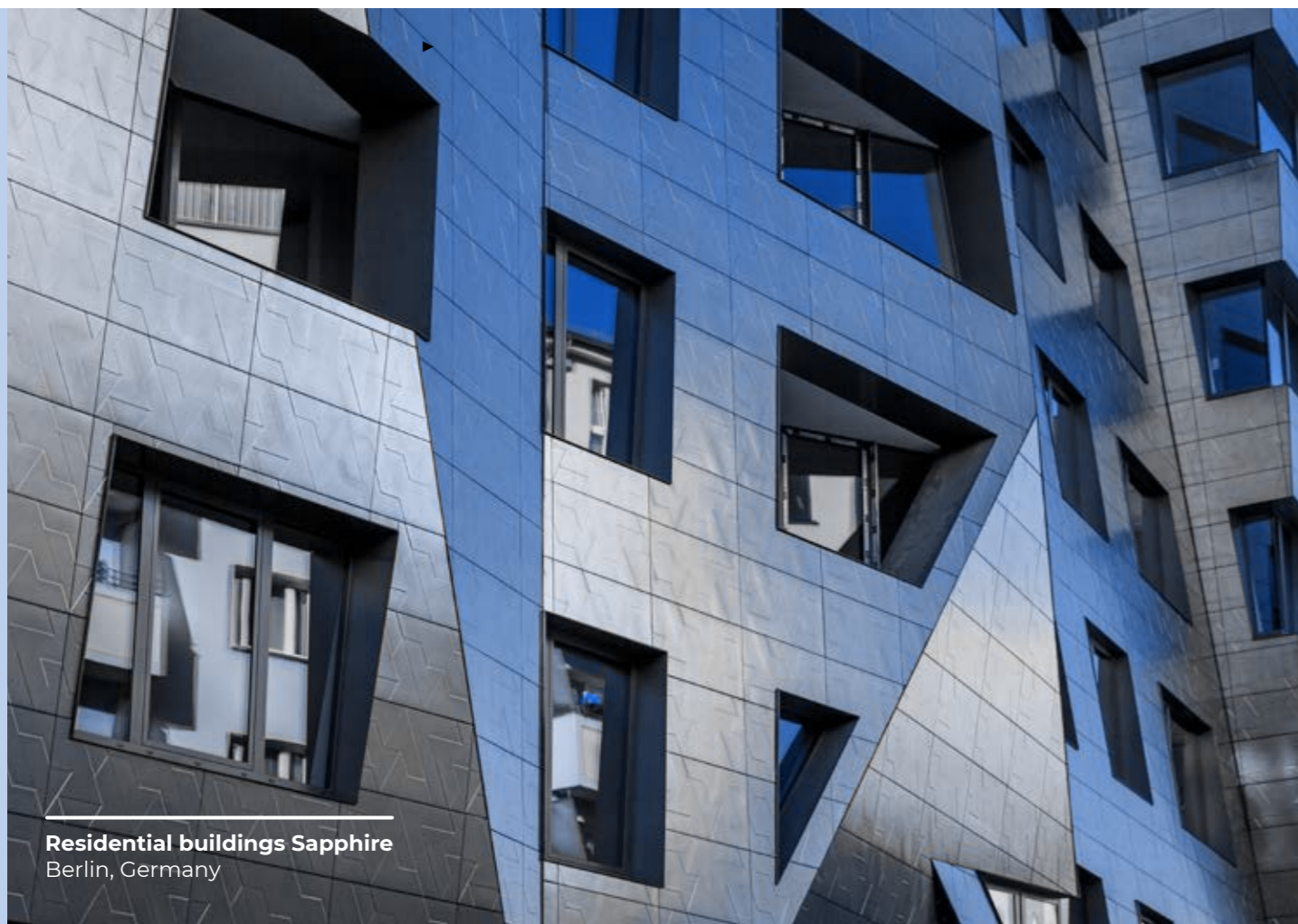
Residential buildings Sapphire Berlin, Germany

W określonych okolicznościach dopuszczalne jest przekazywanie odpowiednich prezentów, darowizn, sponsorowanie lub organizowanie rozrywek. Wymiana prezentów o niewielkiej wartości, powszechnie akceptowanych na poziomie międzynarodowym, może wzmacniać i rozwijać relacje biznesowe; sponsorowanie wydarzenia lub organizowanie rozrywki sprzyja pozytywnej reputacji Grupy Mapei, a przekazywanie darowizn na cele charytatywne jest sposobem na odwdzięczenie się społecznościom w krajach, w których Mapei prowadzi działalność.