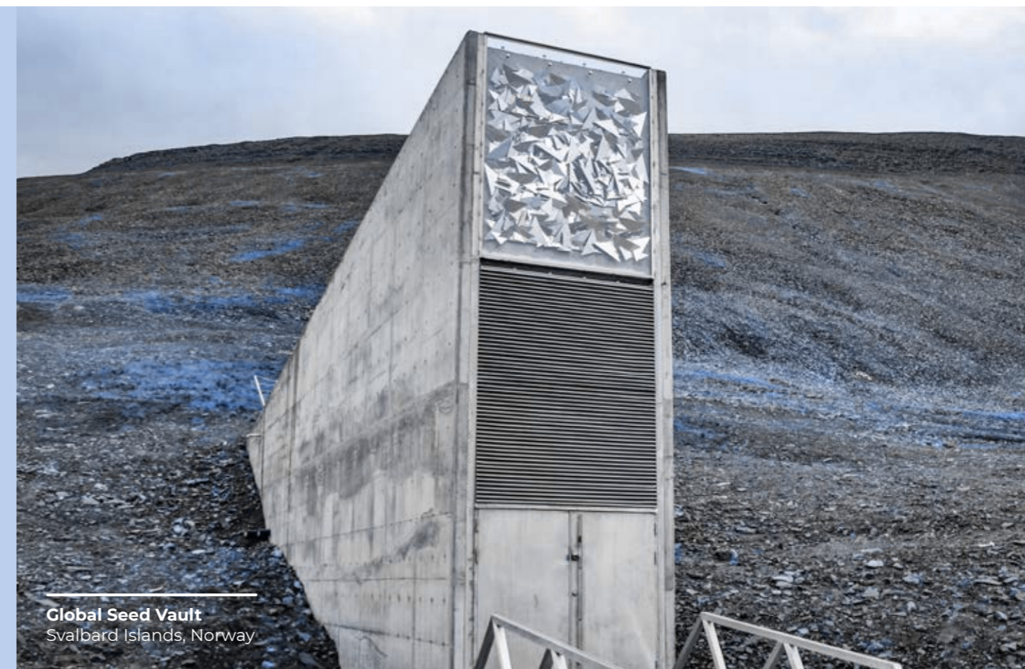
Global Seed Vault Svalbard Islands, Norway

Należy rejestrować i zgłaszać swemu bezpośredniemu przełożonemu i Korporacyjnemu Audytowi Wewnętrznemu wszelkie sytuacje, w których istnieje podejrzenie oszustwa, a także wszelkie zaistniałe przypadki oszustwa.