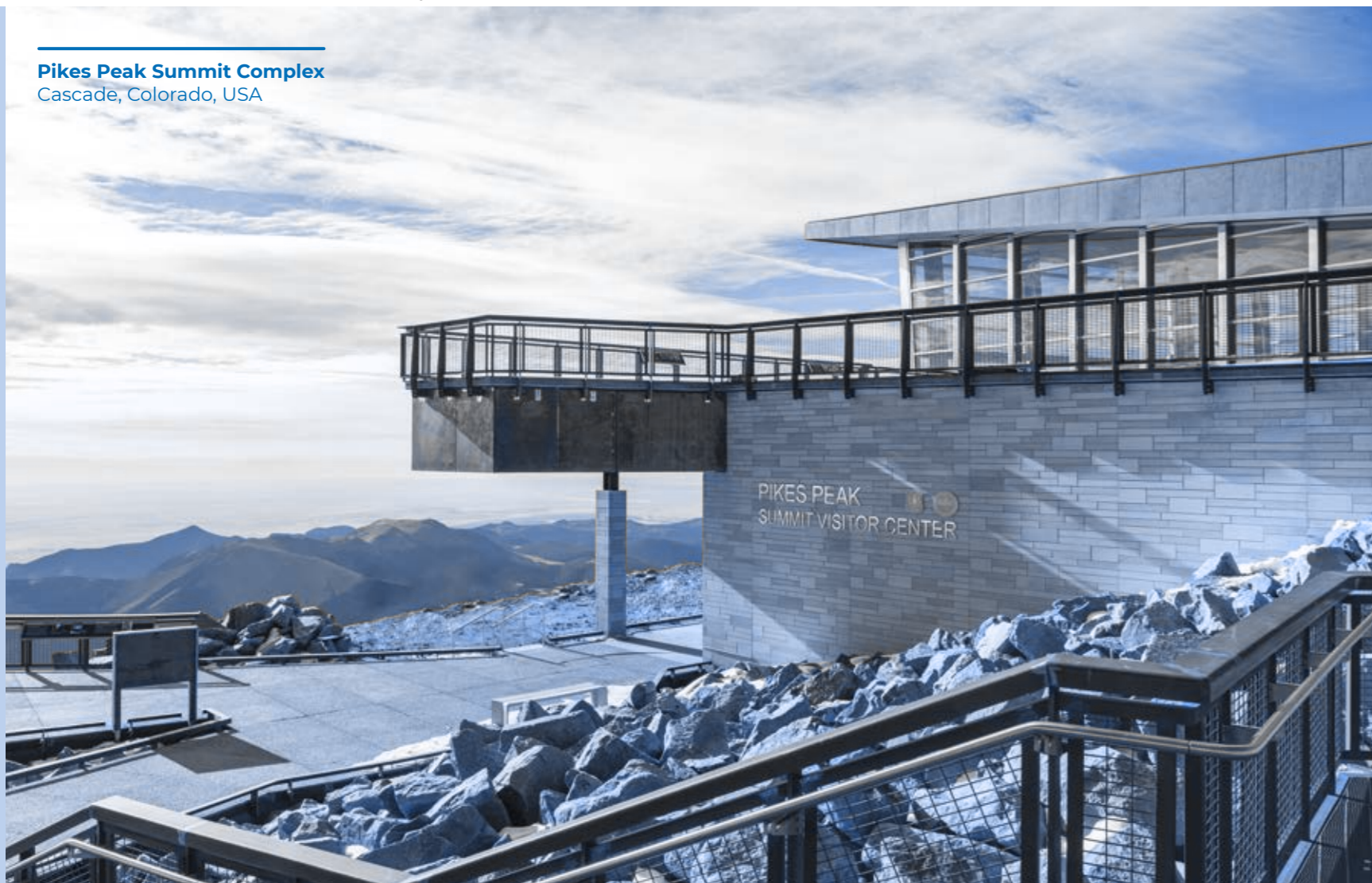
Pikes Peak Summit Complex Cascade, Colorado, USA

W każdym przypadku wszystkim członkom Zespołu Mapei zabrania się przyjmowania lub zabiegania o świadczenia pieniężne, majątkowe lub inne korzyści, czy też usługi jakiegokolwiek rodzaju, udzielane z zamiarem nakłonienia do zatrudnienia, przeniesienia czy awansowania konkretnej osoby.