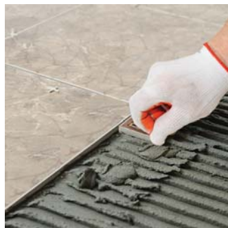
Ker111 ha sido diseñado especialmente para adherir porcelanatos.

Ker111 está disponible en sacos de 20 Kg en colores blanco y gris.