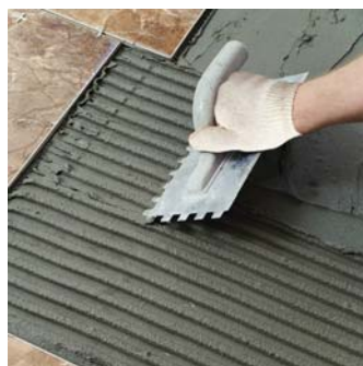
Aplique el mortero en una sola dirección con el lado dentado de la llana.

Coberturas aproximadas del producto* cada 20 kg