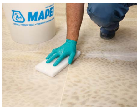
Hrubou houbou Scotch-Brite® odstraňte přebytky rozplaveného Kerapoxy .