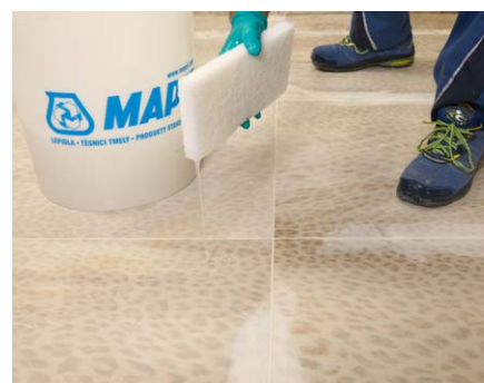
Při čištění dlažby použijte velké množství vody.