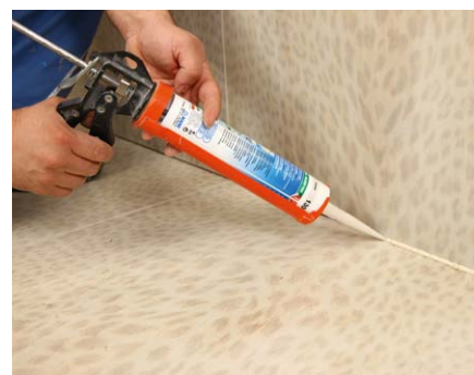
Po zaschnutí Primeru FD (5-10 min.) do spáry aplikujte silikonový tmel Mapefil AC , povrch postříkejte saponátovou vodou a uhladte.