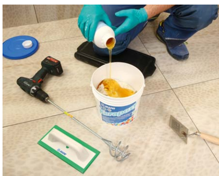
Do složky A přidáme celý obsah složky B.