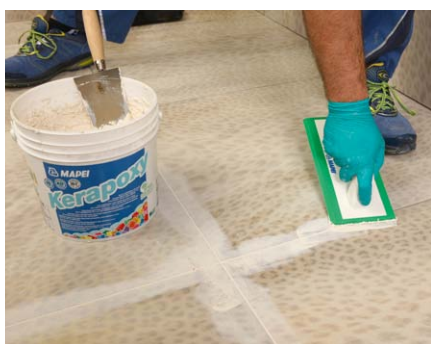
Spárovací hmotu důkladně vtláčte do spáry stěrku v diagonálním směru a přebytky hmoty stěrku setřete.