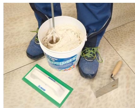
Obě složky spolu velmi dobře promícháme vrtáčkou s míchacím nástavcem (nastavte nízké otáčky).