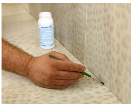
Boční stěny spáry pro zvýšení přídržnosti tmelu potřete penetrací Primer FD ; hluboké spáry vytěsníte profilem Mapefoam .