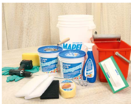
Kerapoxy, Kerapoxy Cleaner a nářadí na aplikaci.