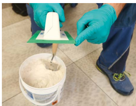
Při aplikaci použijte speciální spárovací stěrku s krátkou hranou.