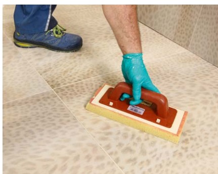
Dočištění provedte houbovým hladítkem; při čištění používejte stále čistou vodu (vodu min. 3x vyměnit).