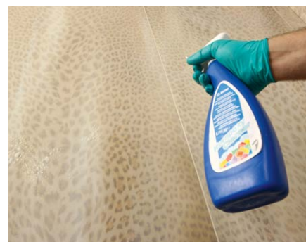
Pokud po dočištění zůstane na povrchu „závoj“ Kerapoxy , odstraňte ho s použitím Kerapoxy Cleaner , povrch následně setřete houbovým hladítkem namočeným ve vodě.