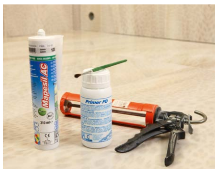
Výrobky a vytlačovací pistole na výplň pružné spáry.