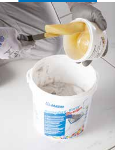
Přidejte tvrdidlo (složka B) do nádoby se složkou A