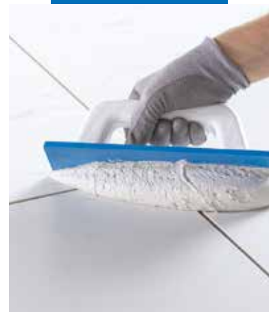
Stěrkou Mapei aplikujte Kerapoxy Easy Design do spár