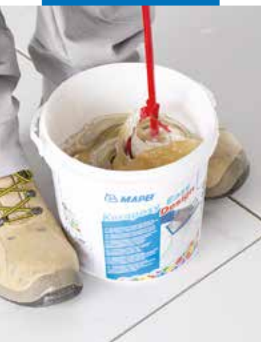
Smíchejte obě složky (A+B)