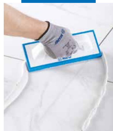
Snadno zpracovatelná epoxidová spárovací malta