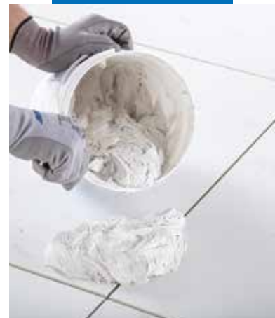
Vznikne krémová homogenní směs

Při konečné úpravě velkých podlahových ploch použijte rotační elektrický čisticí stroj na epoxidové stěrky s diskem Scotch-Brite®. Všechnu přebytečnou tekutinu lze odstranit gumovou stěrkou nebo houbou. Pro konečnou fázi čištění lze také použít UltraCare Kerapoxy Cleaner (speciální čisticí roztok na epoxidové spárovací hmoty). UltraCare Kerapoxy Cleaner lze použít ihned po dokončení spárování a dokončení instalace obkladu. Pokud se čištění provádí až několik hodin po jeho aplikaci, musí se výrobek nechat působit déle (15-20 minut). Účinnost výrobku UltraCare Kerapoxy Cleaner závisí na množství zbytků pryskyřice a době, která od dokončení spárování uplynula. V případě vytvrzených nebo přetrvávajících zbytků výrobku na povrchu obkladu použijte