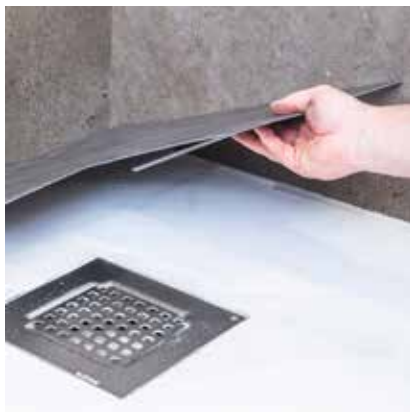
Afløbsrist skal hæves i niveau med LVT.