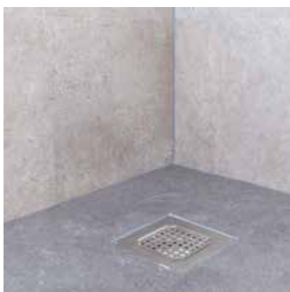
Silikone lægges omkring afløbsrist.