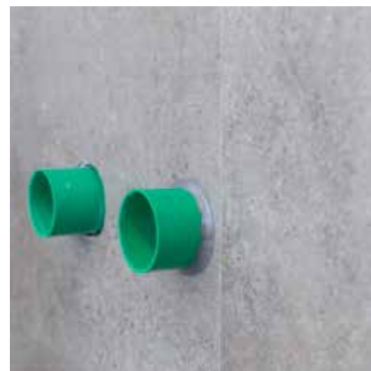
Der fuges med silikone omkring alle rørgennemføringer.