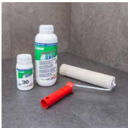
For at forsegle fugerne og give gulvet skridsikring, lakeres overfladen med 2 lag MAPECOAT 4 LVT* .