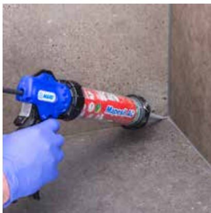
Silikone, MAPESIL AC , påføres i overgange og hjørner samt omkring afløbsriste og alle rørgennemføringer.