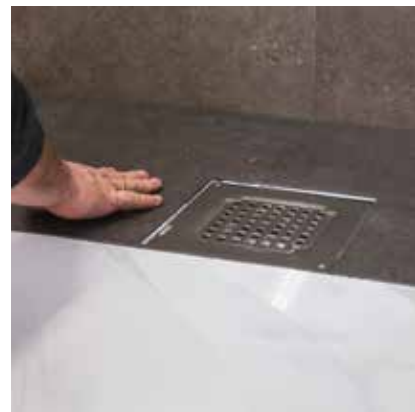
Omkring afløbsristen lægges LVT-fliser med 2-3 mm fordybninger, som udfyldes med silikone.