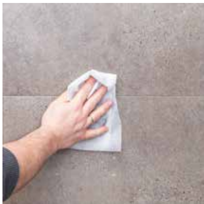
Limspild fjernes let med CLEANER H .