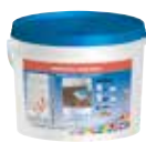
Nivorapid + Latex Plus