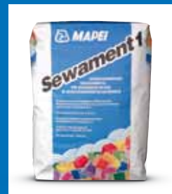
Klebmörtel SEWAMENT 1