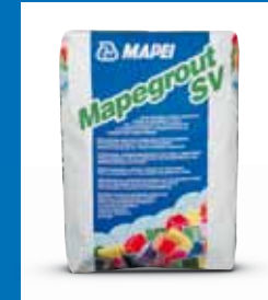
Vergussmörtel MAPEGROUT SV