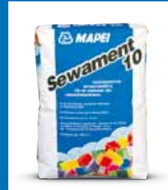
Reparatur- und Beschichtungsmörtel SEWAMENT 10