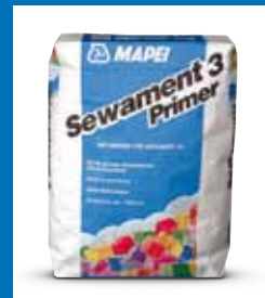
Haftbrücke SEWAMENT 3 PRIMER