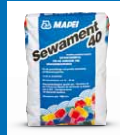
Reparatur- und Beschichtungsmörtel SEWAMENT 40