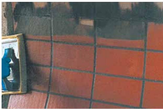
SEWAMENT 2 Verfugen von Steinzeugelementen