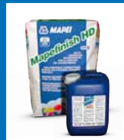
Sulfatbeständiger Beschichtungsmörtel MAPEFINISH HD