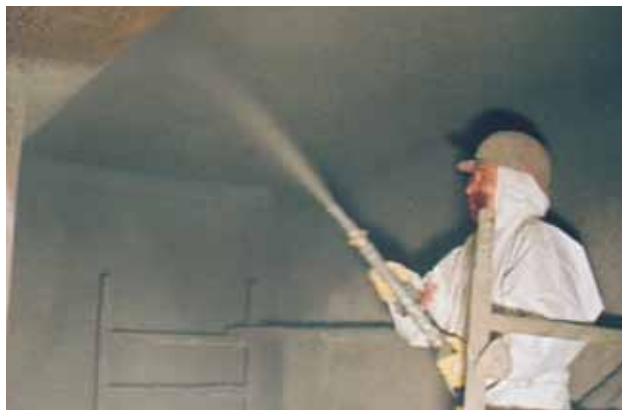
SEWAMENT 10 Verarbeitung im Nassspritzverfahren