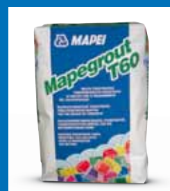
Sulfatbeständiger Reparatur- und Beschichtungsmörtel MAPEGROUT T60