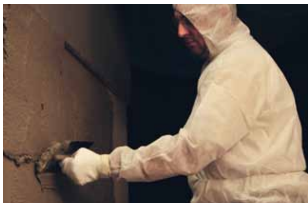
SEWAMENT 40 Handverarbeitung