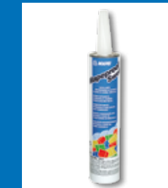
Quellfähiger Dichtstoff MAPEPROOF SWELL