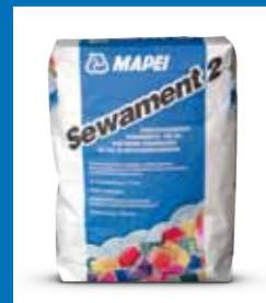
Fugenmörtel SEWAMENT 2