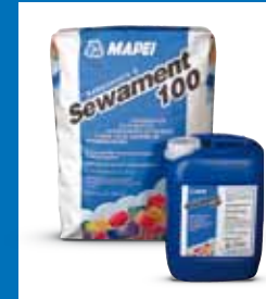
Reparatur- und Beschichtungsmörtel SEWAMENT 100