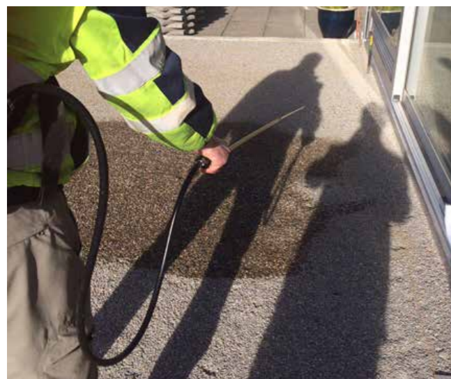
Aufsprühen von MAPESTOP