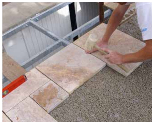
Verlegung auf erhärtetem Drainageestrich im Buttering-Verfahren