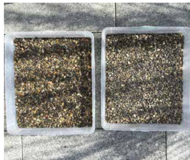
Hydrophobierter Splitt (rechte Seite)