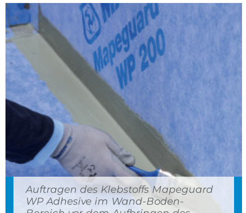
Auftragen des Klebstoffs Mapeguard WP Adhesive im Wand-Boden-Bereich vor dem Aufbringen des Dichtbandes Mapeguard ST