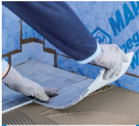
Verlegung von keramischen Fliesen