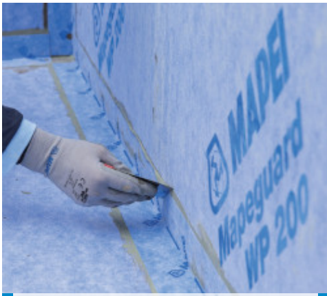
Aufbringen von Mapeguard ST