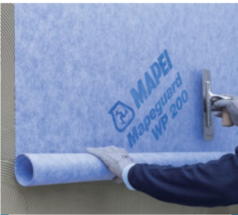
Verlegung von Mapeguard WP 200

Vor Einbau der Abdichtungsbahn ist Mapeflex MS 45 in den Randbereichen des Abflaufs aufzubringen, um die Anschlussbereiche in geeigneter Weise abzudichten.