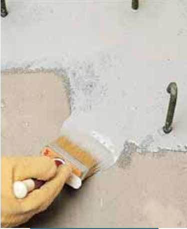
Verarbeitung von Eporip mittels Pinsel als Haftbrücke