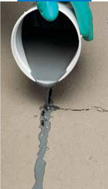
Vergießen von Rissen mit Eporip