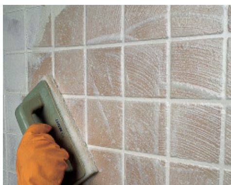
Emulsionarea chitului de rosturi cu ajutorul padului abraziv tip Scotch-Brite®