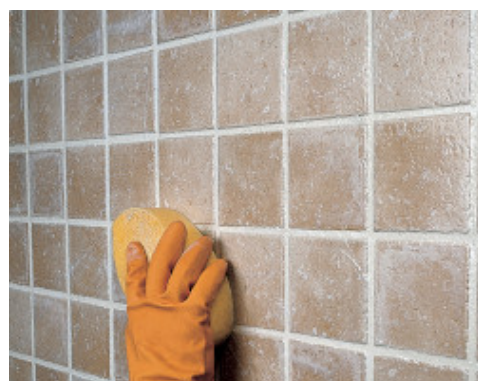
Finisarea si curatarea finala a placilor folosind buretele dur de celuloza Mapei