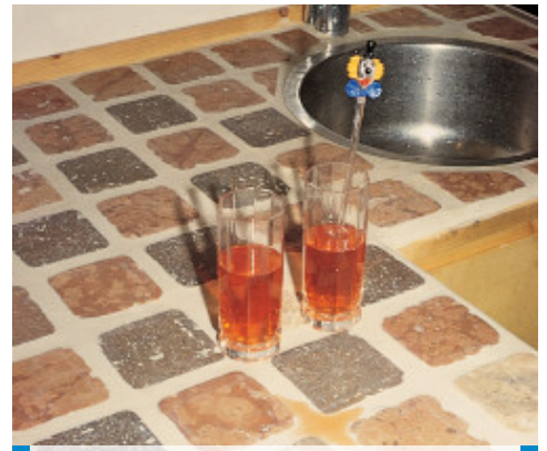
Exemplu de lipire si chituire a unui blat de lucru in bucatarie