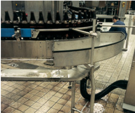
Exemplu de chituire a rosturilor pardoselii dintr-o fabrica de bere