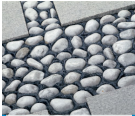
Exemplu de lipire si chituire pentru placaj cu pietre ornamentale