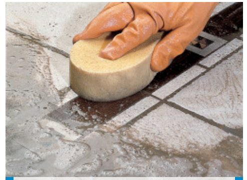
Curatarea si finisarea placilor ceramice cu insertii din lemn, utilizand buretele dur din celuloza Mapei