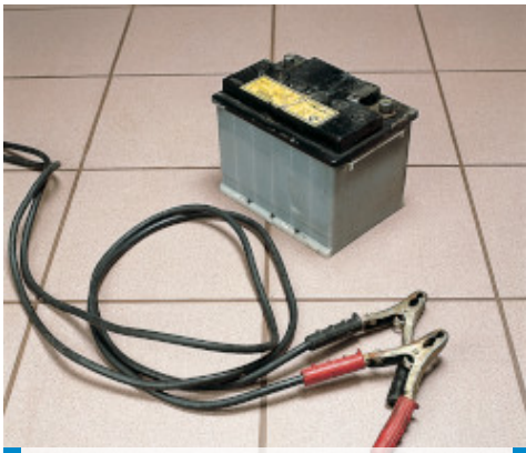
Exemplu de chituire a rosturilor intr-o sala de incarcare a acumulatorilor