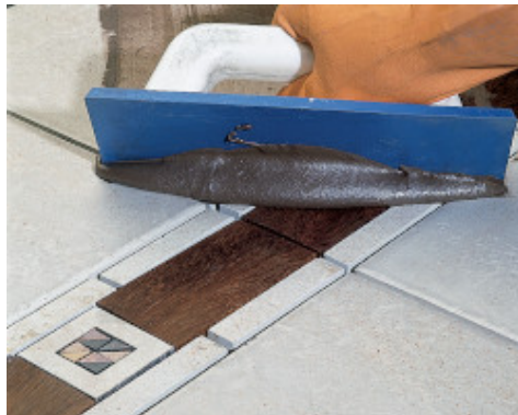
Chituirea placilor ceramice cu insertii din lemn, folosind spatula cauciucata Mapei