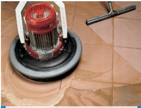
Curatarea si finisarea placilor de gresie portelanata utilizand o masina electrica cu disc din pasla abraziva si racleta de cauciuc