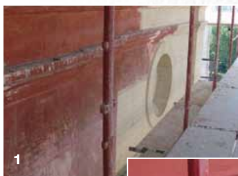
1 Assorbimenti differenziati (prima della tinteggiatura)

L'obiettivo di MAPEI è quello di mettere a fuoco i problemi, studiarli a fondo capendone l'origine e successivamente fornire gli strumenti capaci di risolverli. Nel caso degli interventi di ripristino, si possono presentare molteplici situazioni; ad esempio, modalità applicative, tempi di lavorazione, costi e qualità della manodopera, che talvolta sono di difficile soluzione.