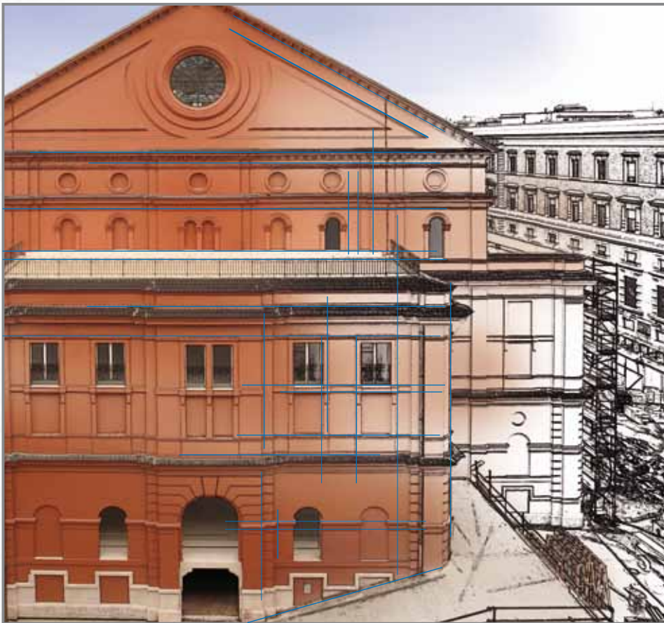
Intervento di ripristino delle facciate del Teatro Petruzzelli (Bari) con: Silexcolor Base Coat e Silexcolor Pittura