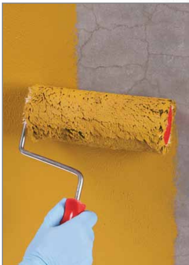
Esempio di applicazione di Quarzolite Base Coat su supporto microcavillato

MAPEI introduce nella proposta dei sistemi di preparazione e coloritura delle facciate 3 nuovi prodotti di fondo multifunzionali: