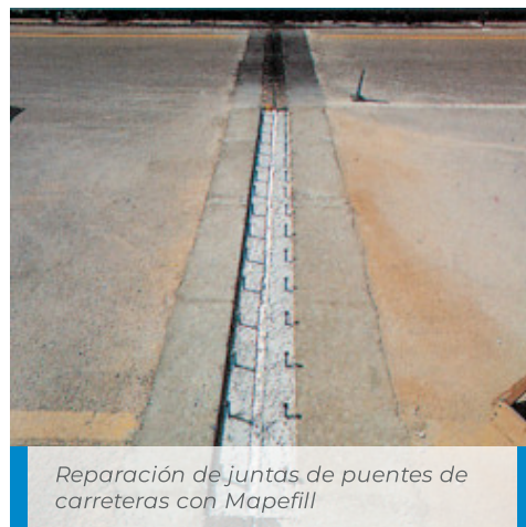
Reparación de juntas de puentes de carreteras con Mapefill