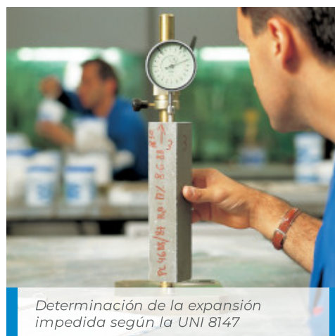
Determinación de la expansión impedida según la UNI 8147