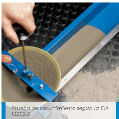
Prueba de escurrimiento según la EN 13395-2