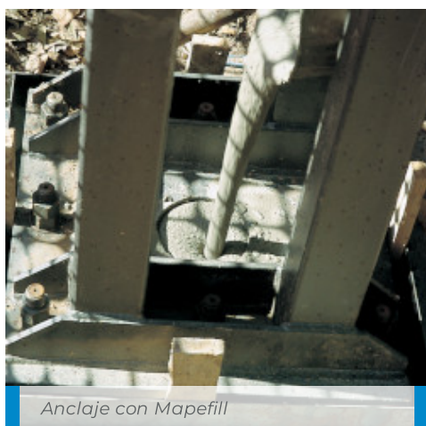
Anclaje con Mapefill