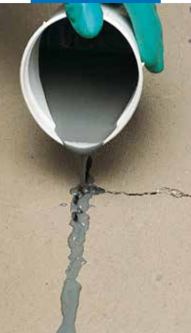
Reparación de grieta en recreado cementoso con Eporip