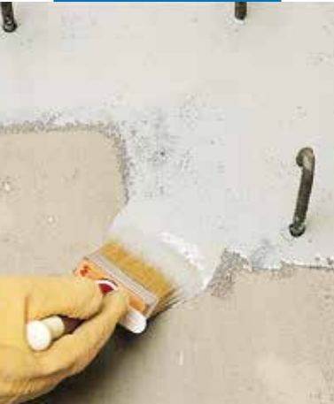
Aplicación de Eporip con brocha para puente de unión