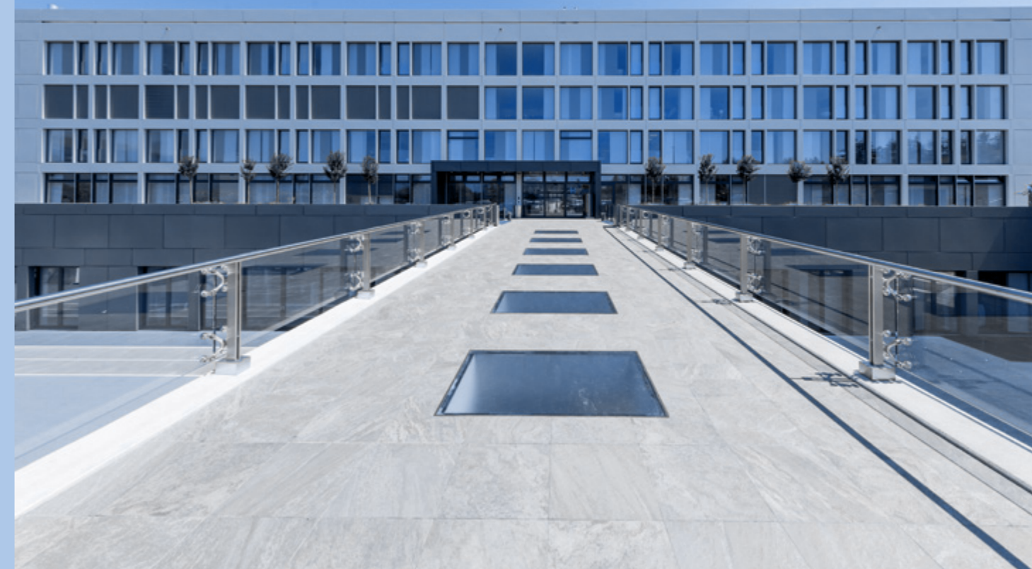
Больница «Де Ла Тур» (De La Tour Hospital) Мерен, Швейцария

внутреннего аудита и отделом кадров) или через онлайн-портал для направления сообщений о нарушениях.