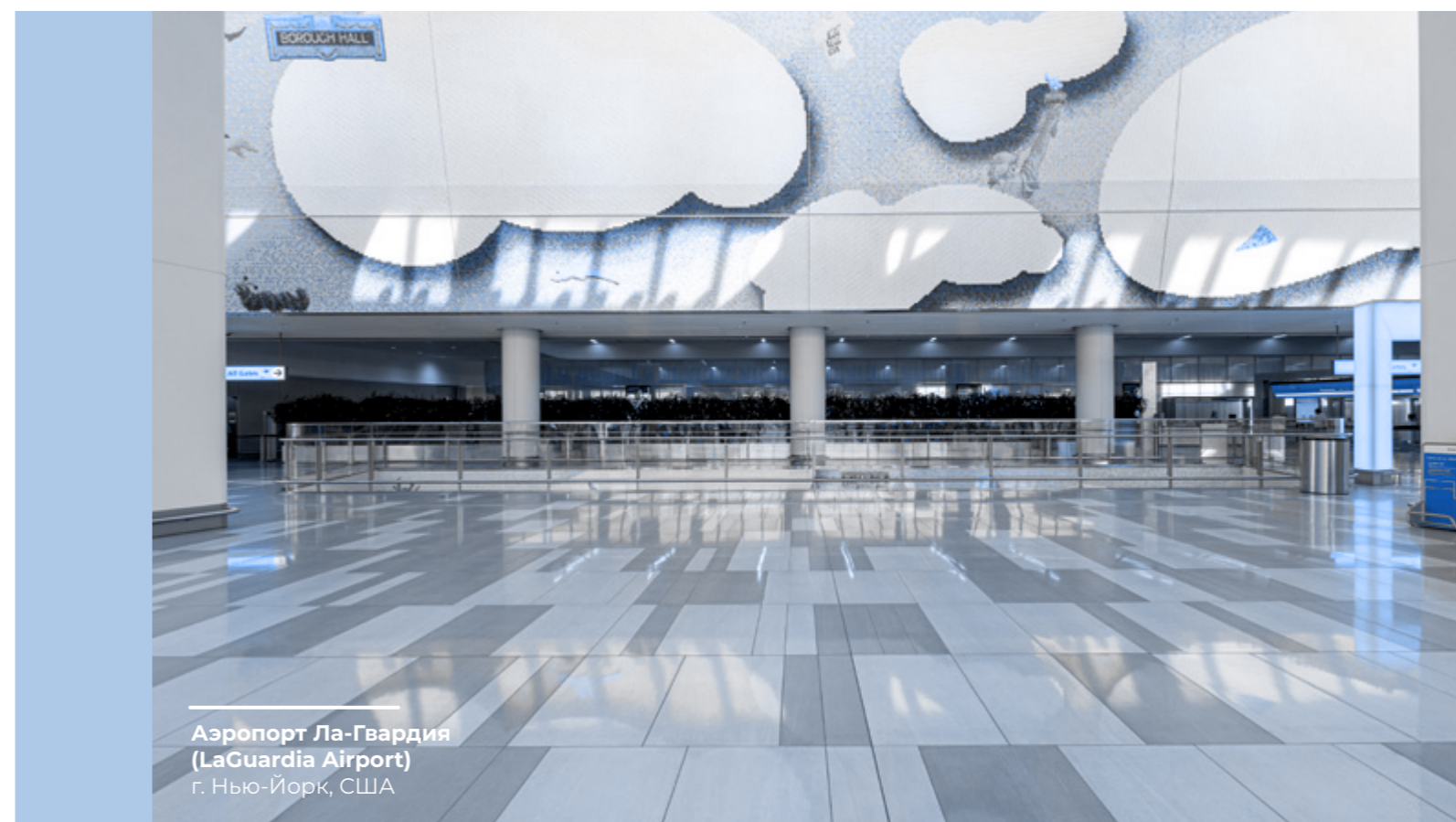
Аэропорт Ла-Гвардия (LaGuardia Airport) г. Нью-Йорк, США

Выражение сомнений и получение разъяснений помогают осуществлять надлежащее управление возникающими ситуациями и решать потенциальные проблемы.