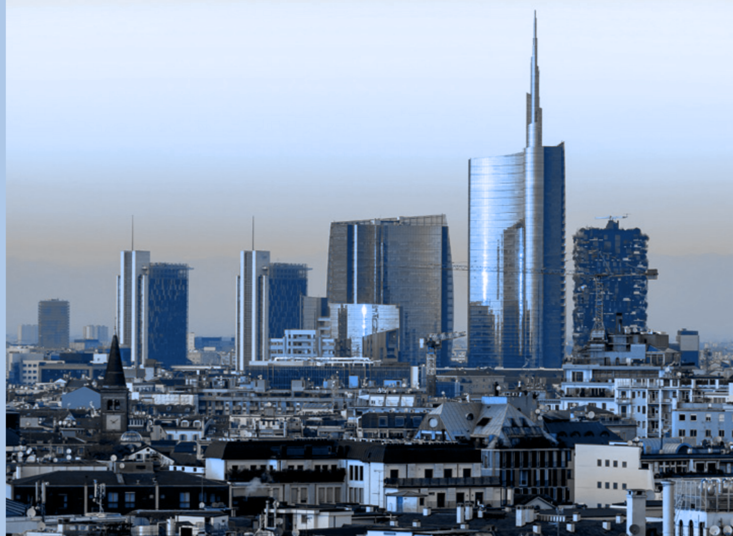
Порта-Нуова (Porta Nuova) г. Милан, Италия

Таким образом, все адресаты Кодекса должны избегать любых ситуаций, в которых может возникнуть конфликт интересов, влияющий на их способность принимать решения исключительно в интересах Группы.