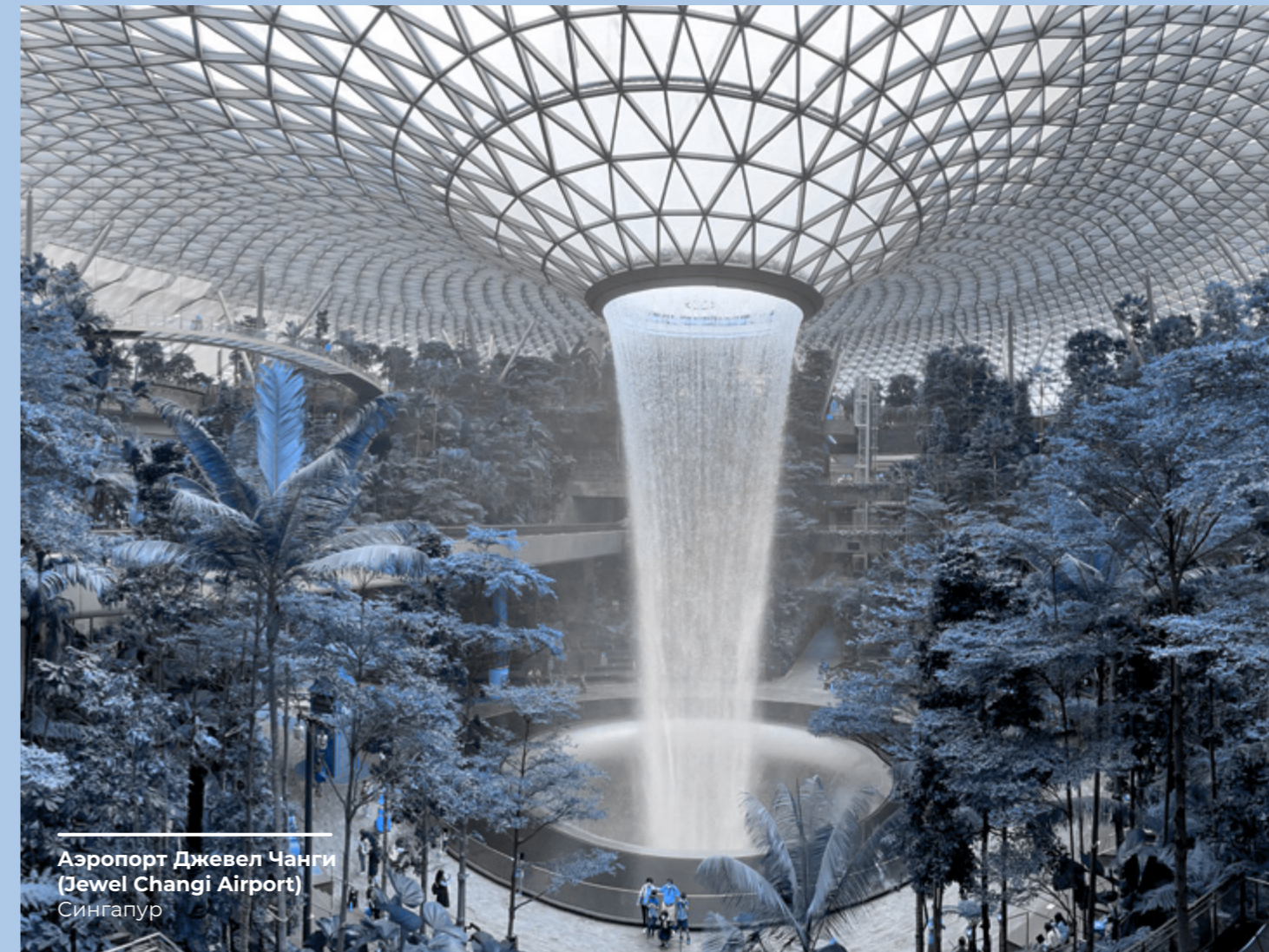
Аэропорт Джewel Чанги (Jewel Changi Airport) Сингапур

Группа запрашивает и хранит только те данные, которые необходимы для эффективного управления