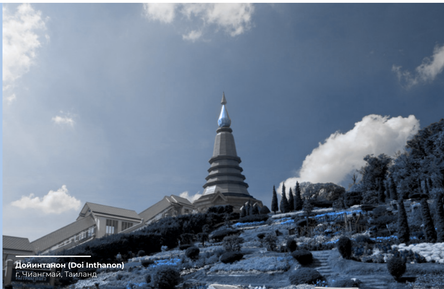
Дойинтанон (Doi Inthanon) г. Чиангмай, Таиланд

Взаимоотношения с местными сообществами, участвующими в деятельности МАРЕИ, также развиваются посредством участия в благотворительных акциях и спонсорской поддержки культурных инициатив или спортивных мероприятий, способствующих развитию территорий, при соответствии положениям настоящего Кодекса и добросовестности получателей.