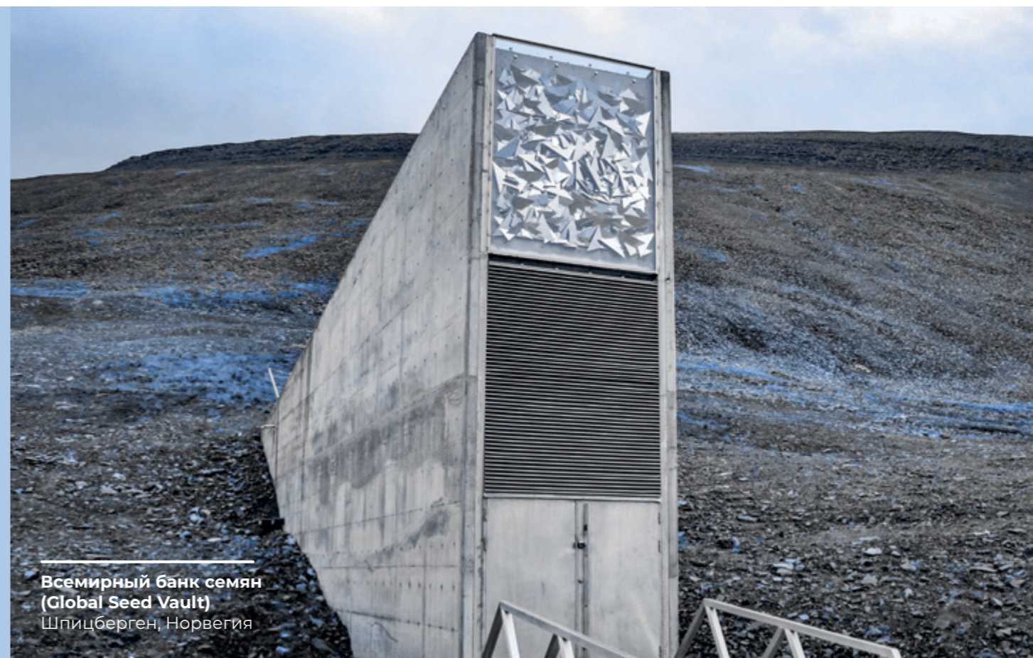
Всемирный банк семян (Global Seed Vault) Шпицберген, Норвегия

Фиксируйте и сообщайте своему непосредственному руководителю и в отдел внутреннего аудита обо всех произошедших или предполагаемых случаях мошенничества.