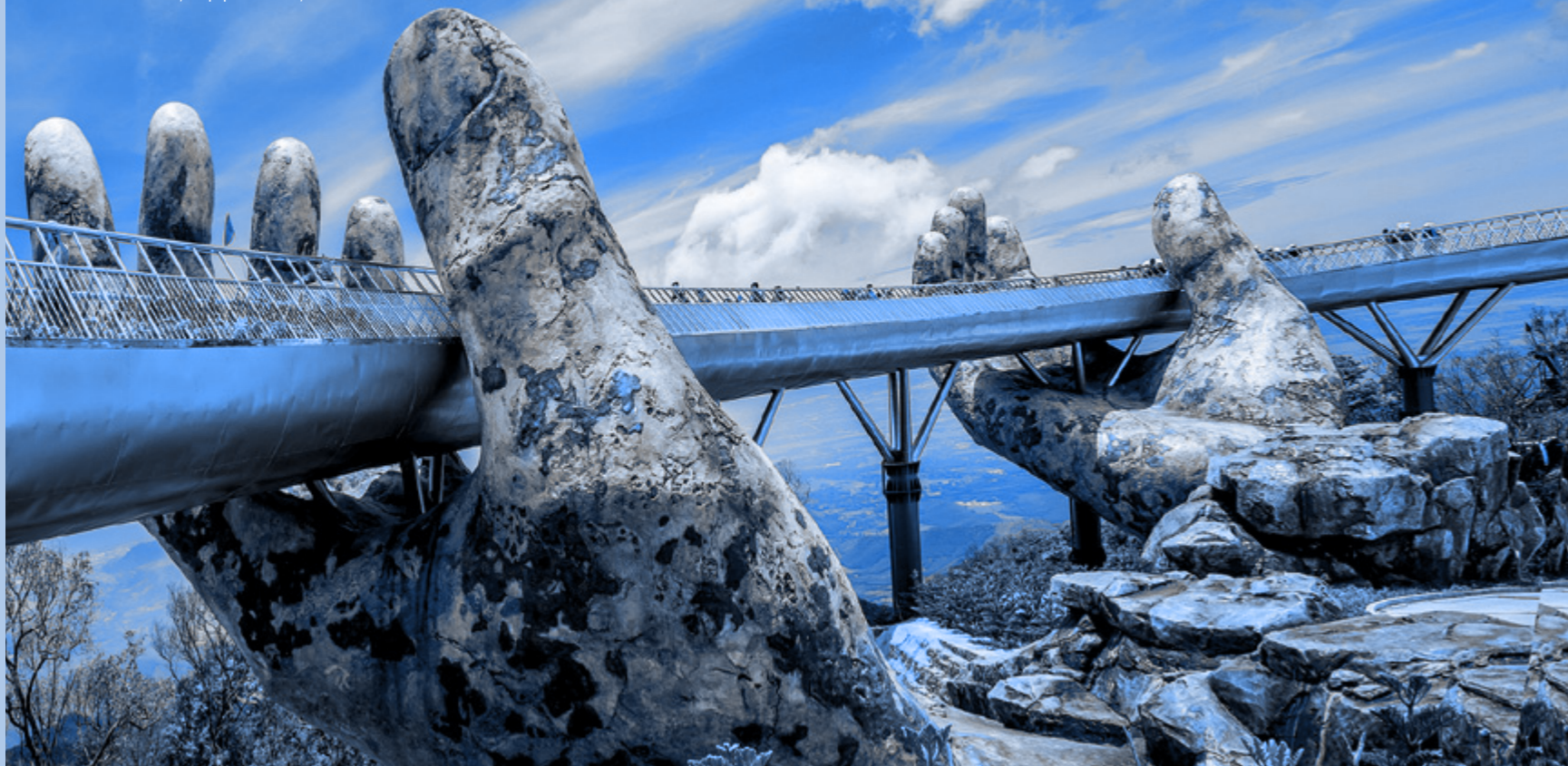
Голден Бридж (Golden Bridge) Ба На Хиллс, г. Да Нанг, Вьетнам

Все директора, генеральные менеджеры и сотрудники компаний Группы MAPEI (далее — «Персонал MAPEI» или «сотрудники»), равно как и другие организации, субъекты и компании, действующие от имени или по поручению Группы MAPEI (далее — «адресаты Кодекса», включая «Персонал MAPEI»), должны осуществлять свою деятельность и выполнять возложенные на них задачи и обязанности в соответствии с принципами, ценностями и правилами, определенными в настоящем Кодексе. Соблюдение Кодекса этики считается важнейшим требованием договорных обязательств для всего Персонала MAPEI.