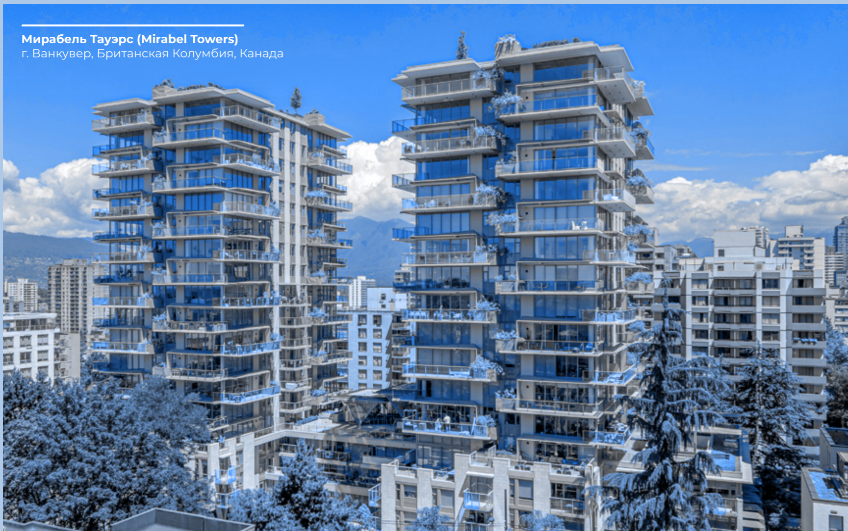
Мирабель Тауэрс (Mirabel Towers) г. Ванкувер, Британская Колумбия, Канада