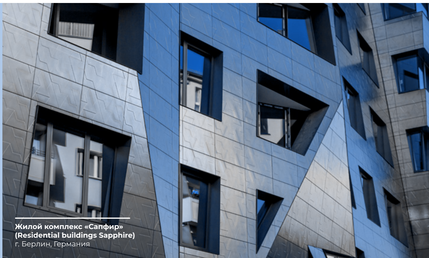
Жилой комплекс «Сапфир» (Residential buildings Sapphire) г. Берлин, Германия

В подобной ситуации допускается создание подарков, участие в благотворительности, оказание спонсорской поддержки или организация развлекательных мероприятий. Обмен подарками небольшой стоимости, которые являются общепринятой практикой на международном деловом уровне, может способствовать укреплению и развитию деловых отношений. Оказание спонсорской помощи для организации или проведения (развлекательных) мероприятий способствует созданию положительной репутации Группы MAPEI. Пожертвования на благотворительные цели — это способ внести свой вклад в развитие общества страны, где MAPEI осуществляет свою коммерческую деятельность.