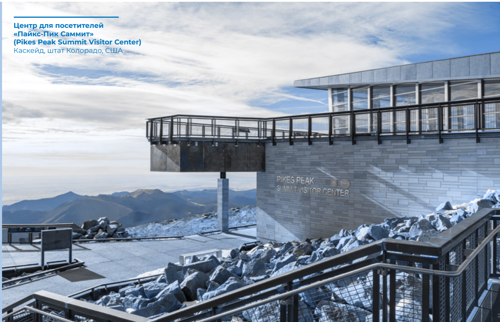
Центр для посетителей «Пайкс-Пик Саммит» (Pikes Peak Summit Visitor Center) Каскейд, штат Колорадо, США

В любом случае всему Персоналу МАРЕИ запрещено принимать или требовать обещания или наличные денежные средства, активы, выгоду или услуги, которые могут каким-либо образом быть направлены на содействие найму конкретного человека в качестве сотрудника или его перевод или продвижение по службе.