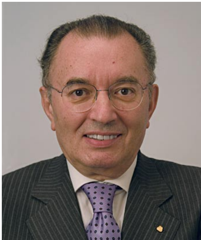
Президент и CEO группы компаний Мареі Джорджіо Сквинси

Компания MAPEI S.p.A. (Италия), основанная в 1937 году в Милане, является одним из крупнейших мировых производителей строительной химии. Название компании — аббревиатура, которая в переводе с итальянского означает «Вспомогательные материалы для строительства и промышленности». На сегодняшний день группе компаний MAPEI принадлежит сеть филиалов и 53 завода в 23 различных странах мира. В ассортименте компании на сегодняшний день более 1150 продуктов и ассортимент постоянно растет. Компания инвестирует 5% от своего оборота в исследования, в этой области работает более 12% персонала. Благодаря сочетанию инноваций, стабильно высокого качества продукции и высокого уровня технической поддержки MAPEI продолжает своё успешное развитие.