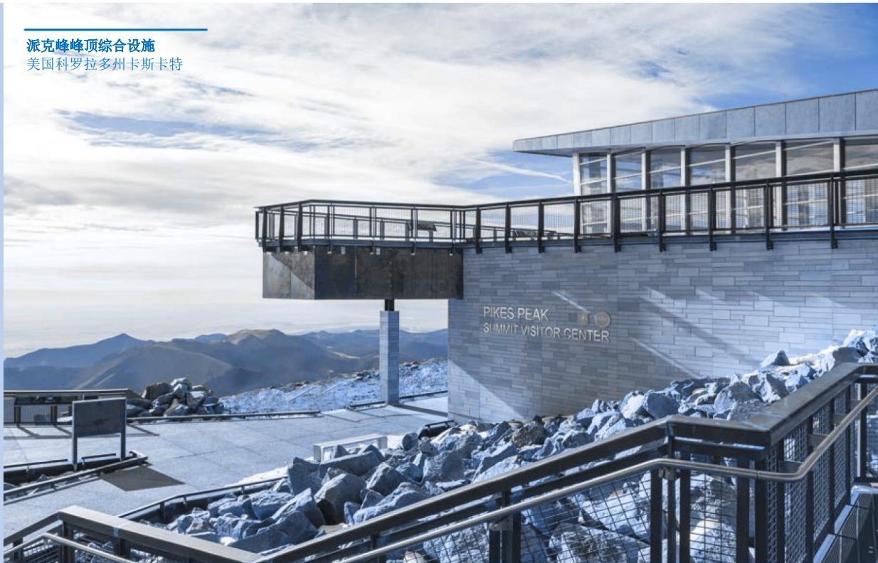
派克峰峰顶综合设施 美国科罗拉多州卡斯卡特

在任何情况下，禁止所有马贝人接受或要求以现金、资产或福利或任何形式的承诺或付款，或以任何方式接受旨在促进聘用特定人员为员工、或调动或晋升任何人员的服务。