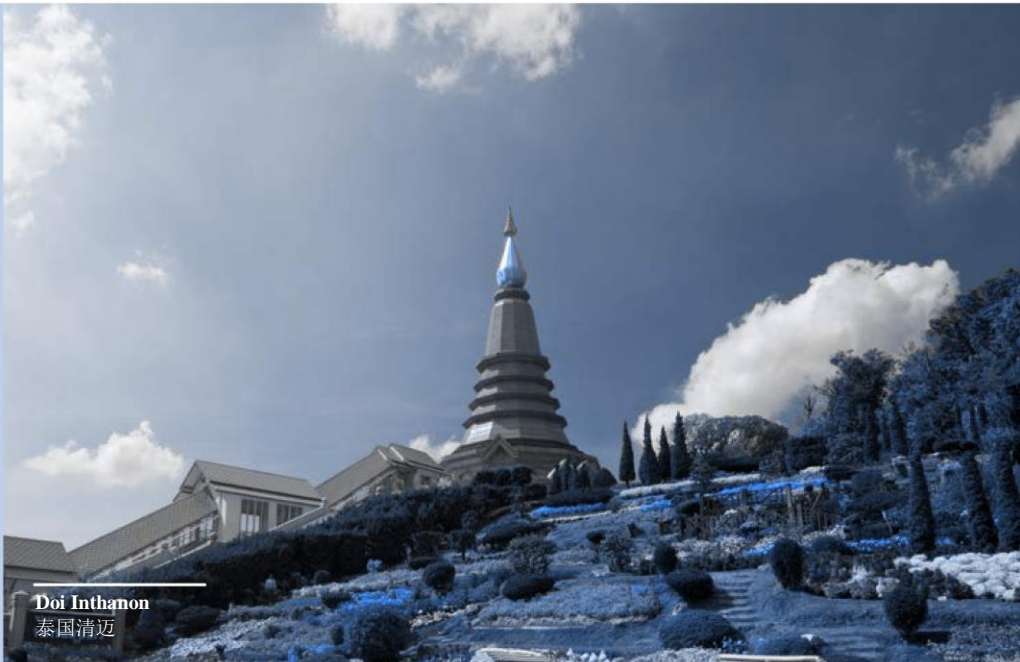
Doi Inthanon 泰国清迈