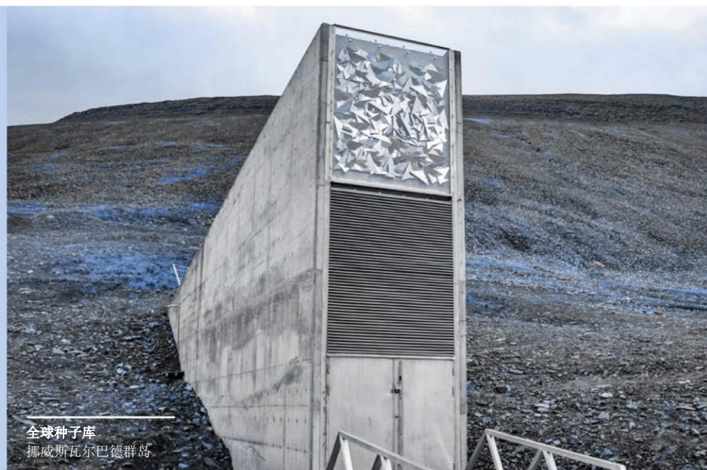
全球种子库 挪威斯瓦尔巴德群岛

记录并向直管经理和公司内部审计部门报告任何可疑的欺诈情况和已发生的任何欺诈案件。