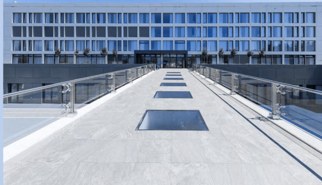
拉图尔医院 瑞士梅林

可通过以下电子邮件地址：codeofethics@mapei.com（由公司内部审核部和人力资源公司及组织部专门管理）或通过在线举报门户网站获得直接向总部举报问题的保密专用渠道。