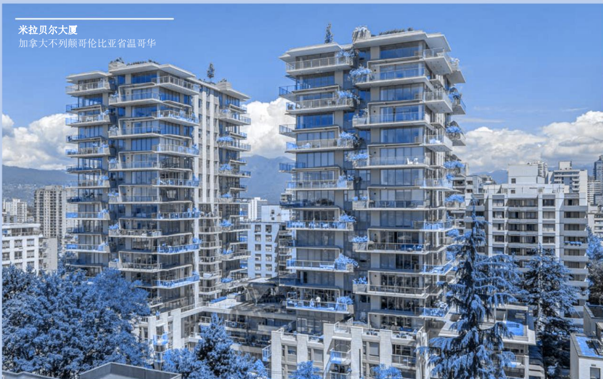
米拉贝尔大厦 加拿大不列颠哥伦比亚省温哥华

集团和所有马贝人应承诺，通过真诚、忠诚、公平、透明的行为，并适当尊重马贝的道德价值观，维护和改善与所有利益相关者的关系。