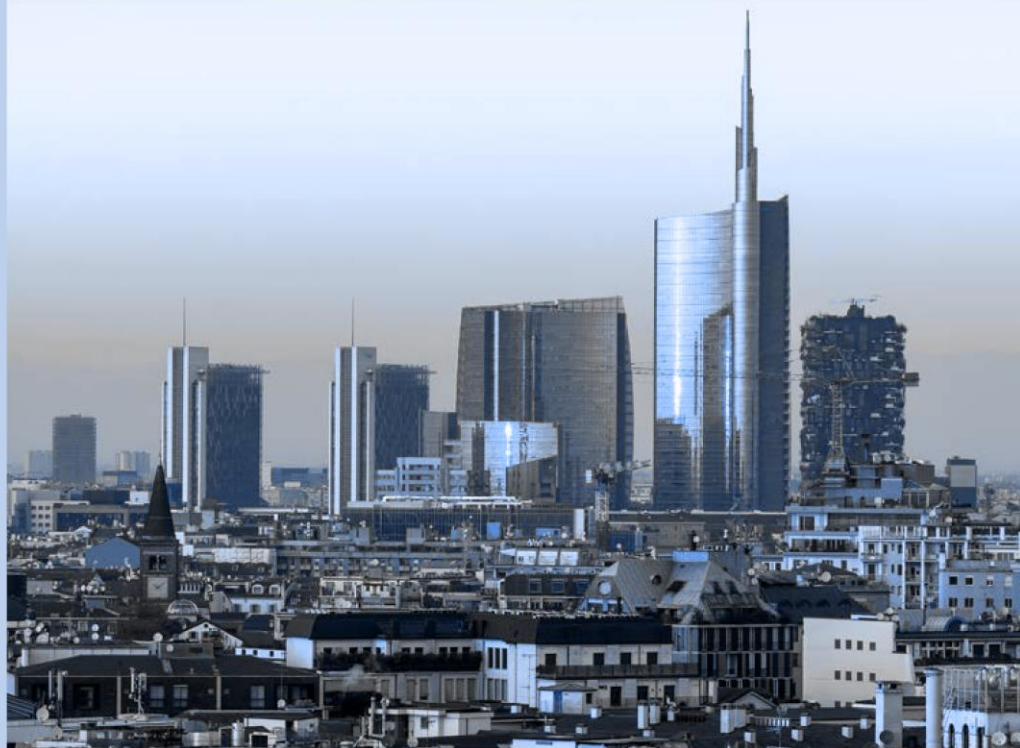
Porta Nuova 意大利米兰

因此，即使只是表面上的利益冲突，所有规范接收人须避免出现任何可能产生利益冲突或干扰其为集团的专门利益做出决策的能力的情况。