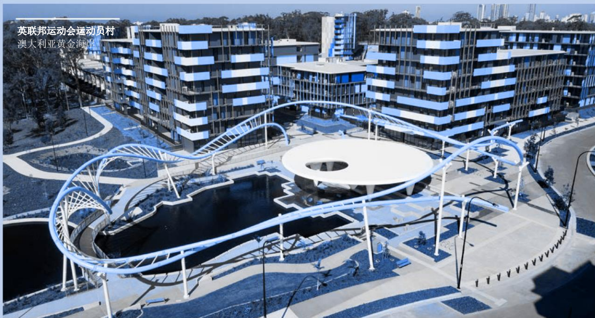
英联邦运动会运动员村 澳大利亚黄金海岸

马贝集团努力保障尊重人权的工作环境，完全避免任何形式的非法、儿童、强迫或胁迫劳动、人口贩运或任何被视为现代形式奴隶制的做法。