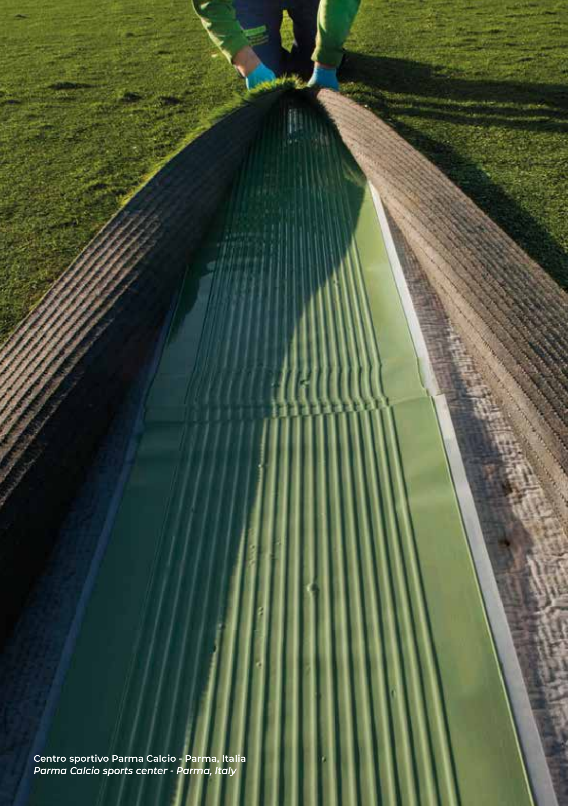
Centro sportivo Parma Calcio - Parma, Italia Parma Calcio sports center - Parma, Italy