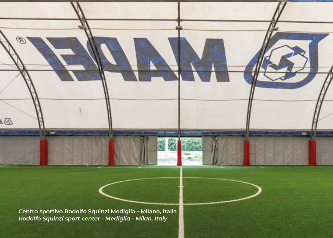
Centro sportivo Rodolfo Squinzi Mediglia - Milano, Italia Rodolfo Squinzi sport center - Mediglia - Milan, Italy