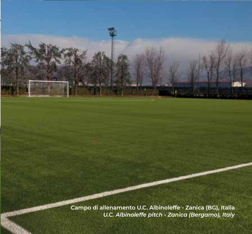
Campo di allenamento U.C. Albinoleffe - Zanica (BG), Italia U.C. Albinoleffe pitch - Zanica (Bergamo), Italy