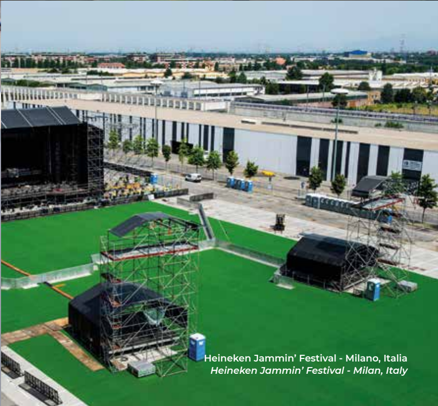
Heineken Jammin' Festival - Milano, Italia Heineken Jammin' Festival - Milan, Italy