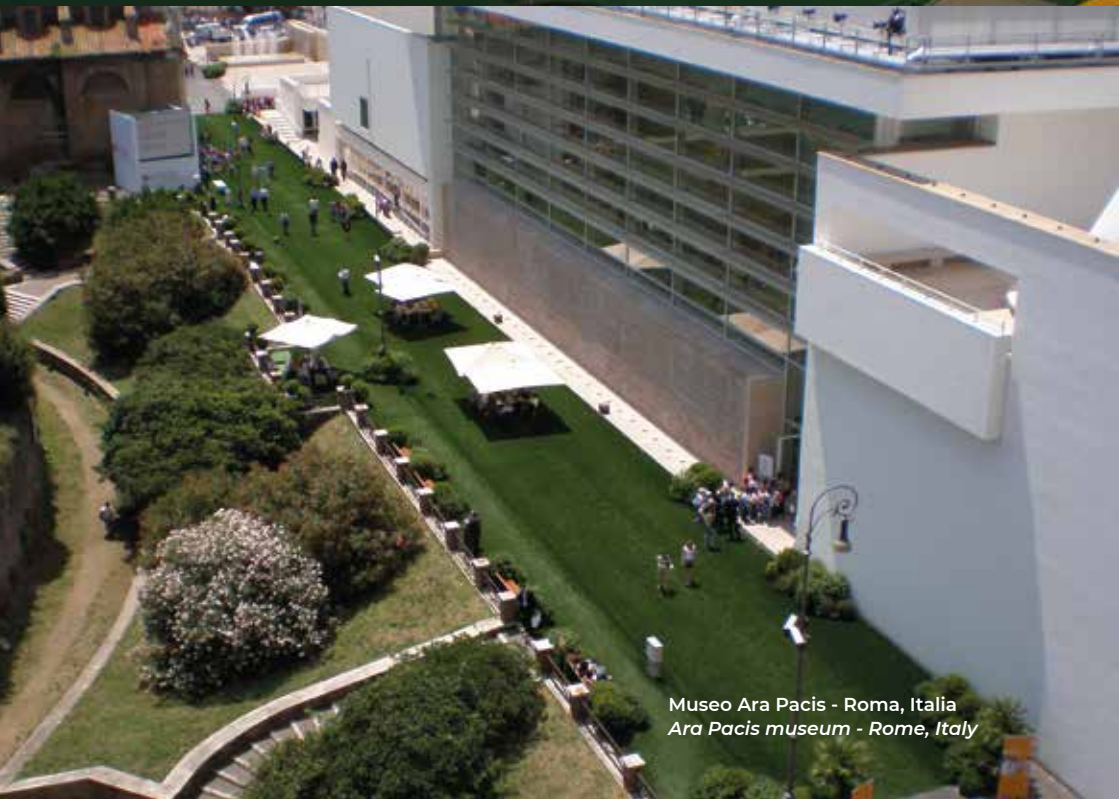
Museo Ara Pacis - Roma, Italia Ara Pacis museum - Rome, Italy