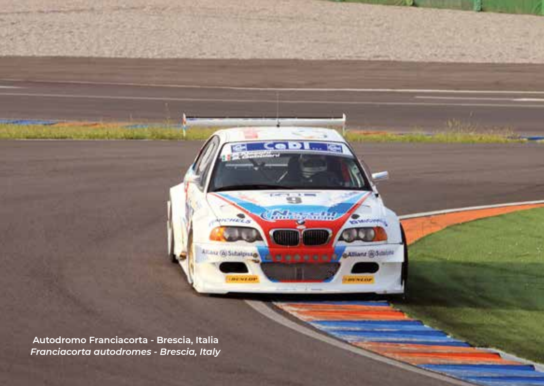
Autodromo Franciacorta - Brescia, Italia Franciacorta autodromes - Brescia, Italy