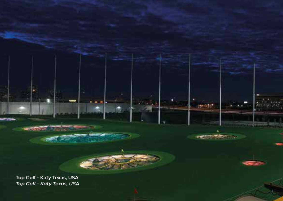
Top Golf - Katy Texas, USA Top Golf - Katy Texas, USA