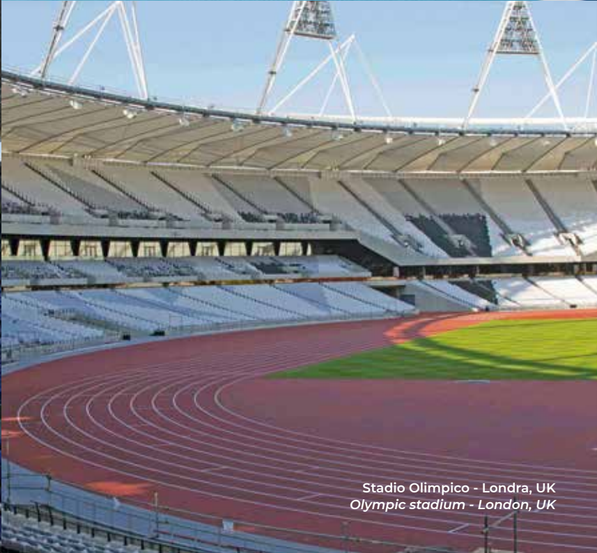
Stadio Olimpico - Londra, UK Olympic stadium - London, UK