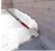
1st layer primer application 第一层涂漆 Aplikasi lapisan pertama primer