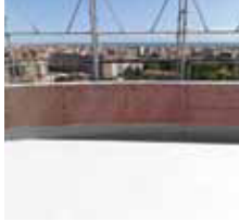
Completed with two top coats 两层涂漆即完成 Selesai dengan dua lapisan di atas