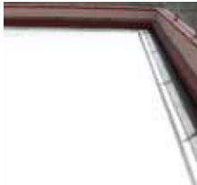
Completed with two top coats 两层涂漆即完成 Selesai dengan dua lapisan di atas