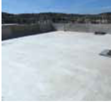
Substrate preparation 准备施用的表面 Penyediaan substrat

使用于混凝土或砂浆表面 / Aplikasi atas permukaan konkrit atau mortar