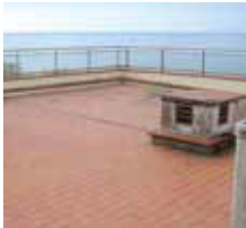
Existing cleaned tile surface 原有干净的瓷砖表面 Permukaan jubin lama yang sudah di bersihkan

使用于原有的瓷砖表面 / Aplikasi atas jubin seramik yang sedia ada