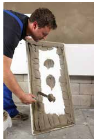
Nanosenie lepidla po obvode a bodovo v strede dosky.