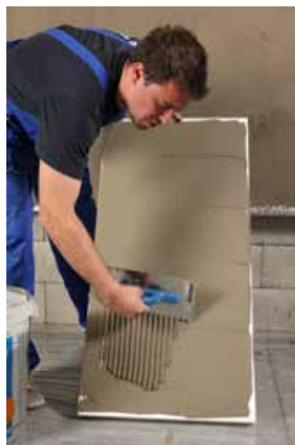
Celoplošné nanosenie lepidla.

Mapetherm AR2 vďaka svojim tixotropným vlastnostiam zabezpečuje stálu polohu nalepených izolantov, bez možnosti sklzu po podklade. V záujme dosiahnutia maximálnej priľnavosti k podkladu sa odporúča materiál spracovať ihneď po jeho zamiešaní.