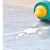
ENKELT ATT RENGÖRA