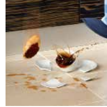
STARK OCH HÅLLBAR