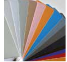
STORT URVAL AV KULÖRER

Ett urval av högkvalitets- och mycket funktionella fogmassor, rika på färg för inomhus och utomhus bruk. Lösningssmedelsfria, med mycket låga utsläpp av flyktiga organiska ämnen (VOC) och certifierade enligt de mest strikta internationella standarder. Lämpliga för alla typer och format av keramiska plattor, stenmaterial och mosaik. Våra fogmassor är cementbaserade, epoxibaserade och finns även som elastiska fogmassor. Mapei Coloured Grouts Selection. Valet som avslutar varje projekt. Från Mapei, världsledande inom tillverkning av fogmassor och lim. Mapei är vid din sida: Låt oss ta en djupare titt tillsammans på www.mapei.se