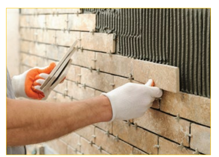
لاصق أسمنتي بدون إنزلاق رأسي لبلاط السيراميك .مصنف C1T وفقاً إلى EN 12004 o ISO 13007-1

EN 12004 as class C1T GSO ISO 13007-1 as class C1T EN 12004 as class C2ES1 (if mixed with Isolastic 50%) GSO ISO 13007-1 as class C2ES2 (if mixed with Isolastic 100%) ANSI A 118.1