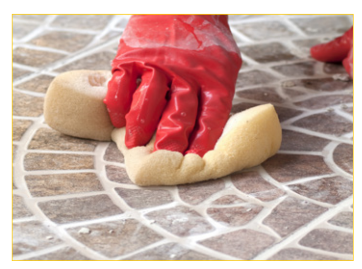
مادة من الأسمنت المعدل بالبوليمر عالية الأداء وسريعة الجفاف لملئ فواصل البلاط من 2 إلى 20 ملم مصنف CG2WA وفقاً لـ 3-13007 ISO و EN 13888.

Due to the printing processes involved, the colours should be taken as merely indicative of the shades of the actual product.