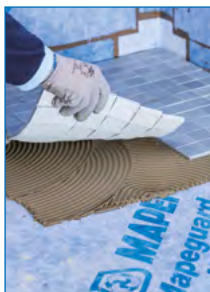
Verlegung von Glasmosaik auf Mapeguard WP 200