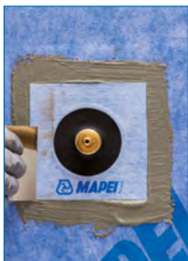
Auftrag von Mapeguard PC