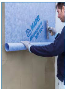
Verlegung von Mapeguard WP 200