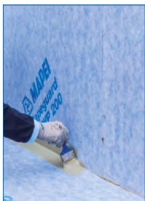
Auftrag des Klebemörtels Mapeguard WP Adhesive zur Verklebung von Mapeguard ST