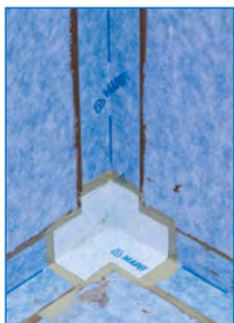
Detail einer abgedichteten Innenecke mit Mapeguard IC