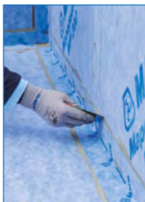
Auftrag von Mapeguard ST