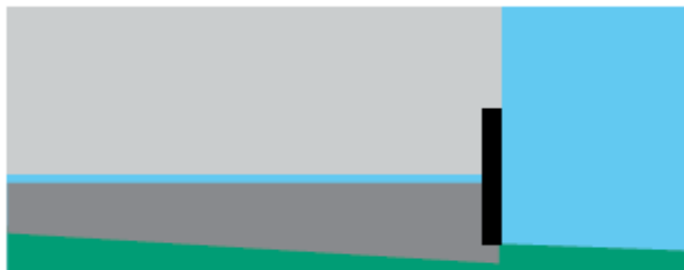
Figur over: Ved understøp av fundamenter vil betongen normalt sette seg, og understøttelsen blir ufullstendig.