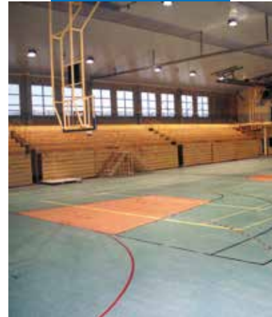
Eksempel på applisering av Primer G før legging av PVC og lineoleum i idretteshallen Gdansk Orunia Gymnas - Polen

Alle referanser for produktet er tilgjengelige på forespørsel og på vår hjemmeside www.mapei.no