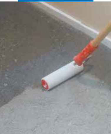
Påføring av Primer G med rull