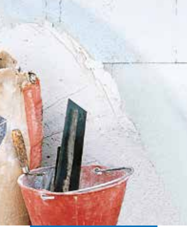
Brukt som primer på gipsvegg