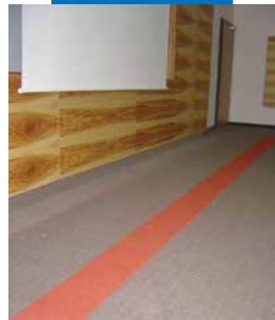
Primer G før utlegging av Ultraplan Eco og Rollcoll lim, brukt for å feste gulvteppe i hotellrom på Villa Hotel Castellani - Østerrike