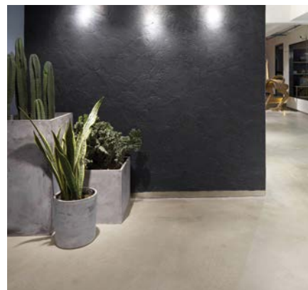
MAT Mapefloor Finish 58 W