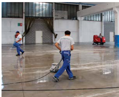
Fini de haute performance – Mapecrete Hard LI

Mapefloor Finish 630 est un agent filmogène acrylique, protecteur et à deux composants, dans une dispersion aqueuse pour les planchers constitués de béton et des systèmes Ultratop . Il procure une bonne résistance aux UV ainsi qu'un fini de haute performance.