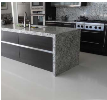
LUSTRÉ Mapefloor Finish 53 W/L