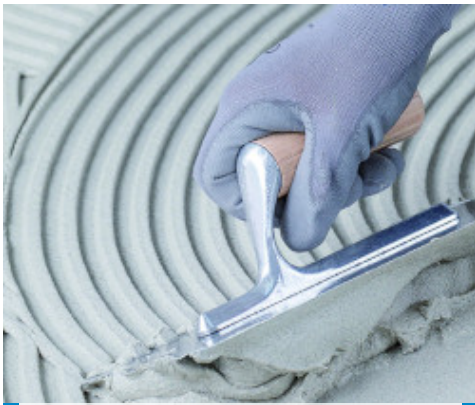
Aplicación de Adesilex P9 Porcellanato blanco