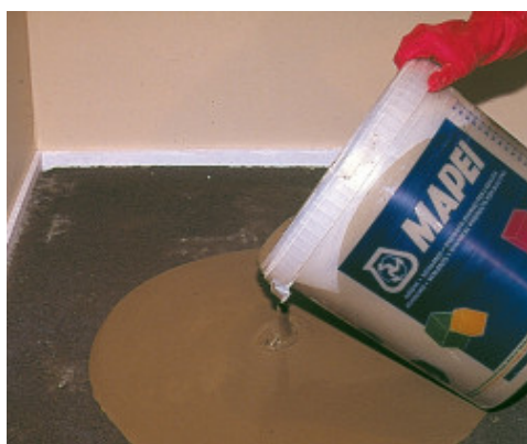
Aplicación de la mezcla Novoplan 1-10 sobre el soporte.

El tiempo de espera antes de la instalación puede variar dependiendo de la temperatura y humedad del ambiente, el espesor y el tipo de pavimento a instalar. En cerámicos esperar entre 3-12 horas y en pavimentos resilientes y suelos de madera de 24-72 horas.