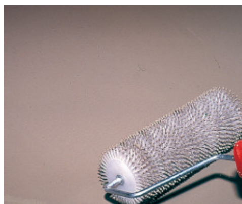
Uso de un rodillo rompe burbujas sobre Novoplan 1-10