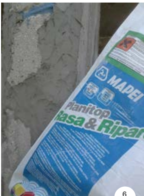
FOTO 6. Reparação do betão degradado com o sistema MAPEFER 1K + PLANITOP RASA & RIPARA.

Para mais informações sobre os produtos, visitar o site www.mapei.pt