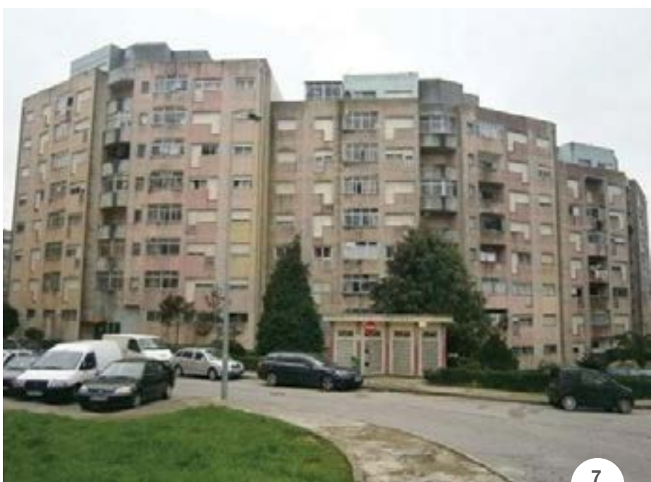
FOTO 7. Antes da intervenção. FOTO 8. Depois da intervenção.