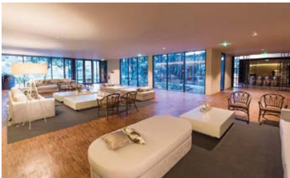
FOTO 5. Pavimento acabado com o sistema Ultracoat Oil, após betumagem com Ultracoat Oil Aqua Plus.

FOTO 4. Afagamento do pavimento em madeira.